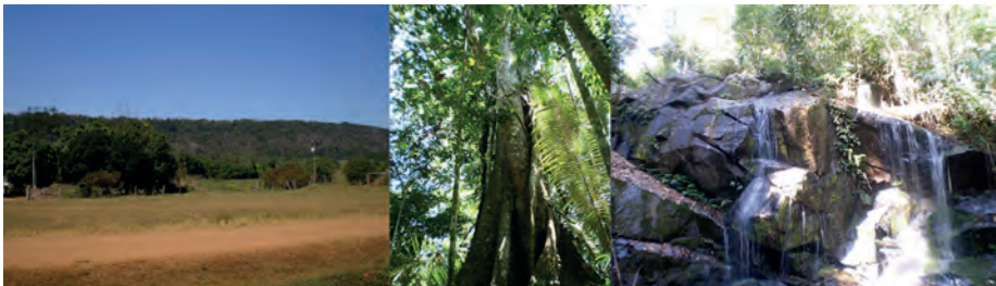
Figura 4: Fotomontagem com sequências do Bloco de Reserva Legal do PA Margarida Alves: a floresta ao fundo, árvore selecionada para corte pelo plano de manejo florestal e cachoeira (fotomontagem).

Para que o plano de manejo entrasse em vigor, os órgãos ambientais exigiram uma adesão proporcional dos moradores ao tamanho da área a ser explorada. Assim, seria necessária a anuência de cerca de metade das famílias do assentamento para que o projeto saísse do papel. Ainda que se trate de um projeto que traz benefícios econômicos, a adesão só ocorreu de forma massiva entre os moradores das agrovilas - com afinidades ao MST. Os moradores dos lotes retangulares viram com desconfiança esse novo plano e em razão de feridas abertas do passado recusaram uma filiação em massa à COOMEAFES, vista por eles como a “cooperativa do MST”. Outros relatos dão conta de que alguns moradores dos lotes tradicionais, de forma pontual, recusaram-se a aderir ao plano por praticarem extração ilegal de madeira e que o plano de manejo traria de alguma forma um maior controle social e do poder público sobre a reserva legal.