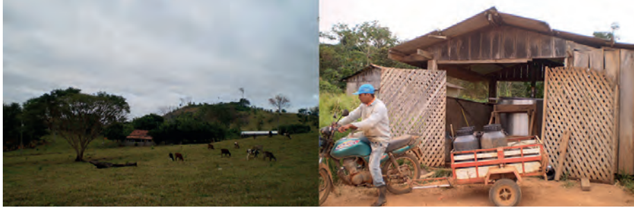
Figura 3: Pasto e tanque de leite no PA Margarida Alves (fotomontagem).

entre a primeira e a segunda fase do programa. Esses números colocam hoje as alocações sociais e os salários em igualdade de importância à lavoura como segunda fonte geradora de renda do assentamento. Soma-se ainda o fato de que o pasto é menos sujeito às mudanças e intempéries climáticas do que as atividades de lavoura.