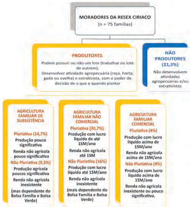
Figura 2: Tipologia das famílias entrevistadas a partir de critérios de produção e renda.

Para as 75 famílias entrevistadas, a categoria mais lucrativa é a farinha de mandioca (70,7%), seguida pelo gado. Essa discrepância entre a lucratividade da farinha e do gado pode estar relacionada ao fato de que, de acordo com o Plano de uso da RESEX de Ciriaco, os usuários devem respeitar o limite de 10 cabeças de gado. O gado, apesar de ter a função de poupança, pode ser um fator importante para que os agricultores tenham mais segurança na tomada de decisão da agricultura (o que plantar, diversificação da produção).