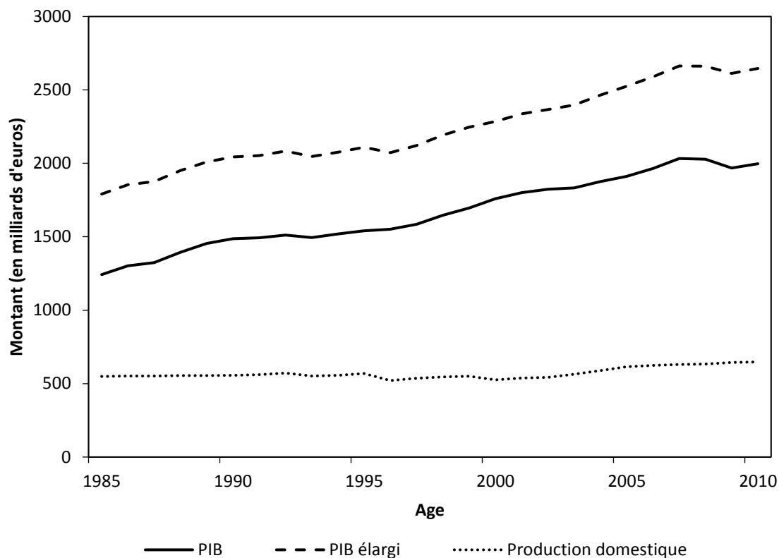
Figure 2. Indicateurs de richesse et production domestique en niveau 1985-2010