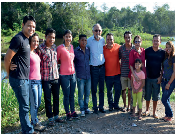
Figura 2: Equipe do novo projeto financiado pelo Fundo Banco do Brasil composta, em sua maioria, por jovens formados com bolsas do Fundo Social da Natura, junto ao Senador João Alberto Capiberibe, no centro.

alunos da comunidade possam continuar a estudar fora da Vila. Essas bolsas foram as primeiras ações a serem desenvolvidas e têm consequências positivas no que diz respeito à melhoria do nível escolar das pessoas que nasceram na comunidade. Apesar de favorecer a migração para centros urbanos onde encontram empregos mais condizentes com a sua qualificação, hoje tem-se um retorno concreto com um novo projeto financiado pelo Fundo Banco do Brasil, cuja execução administrativa é assegurada pelos jovens formados com o auxílio das bolsas.