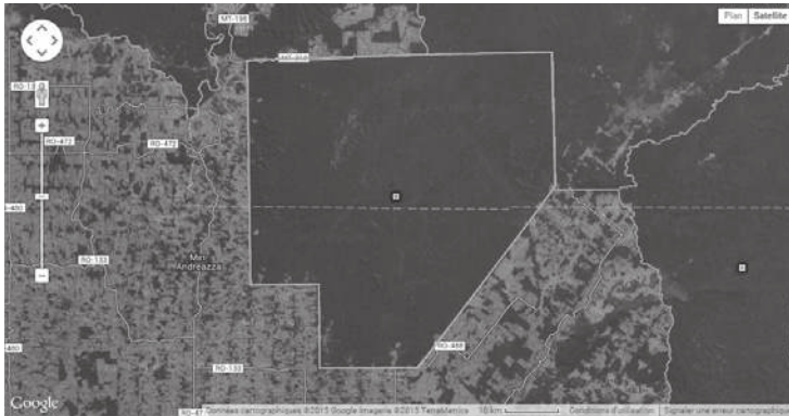
Fig. 4 – La terre indigène « 7 septembre » en Rondônia, une île de forêt face à la vague de déforestation.