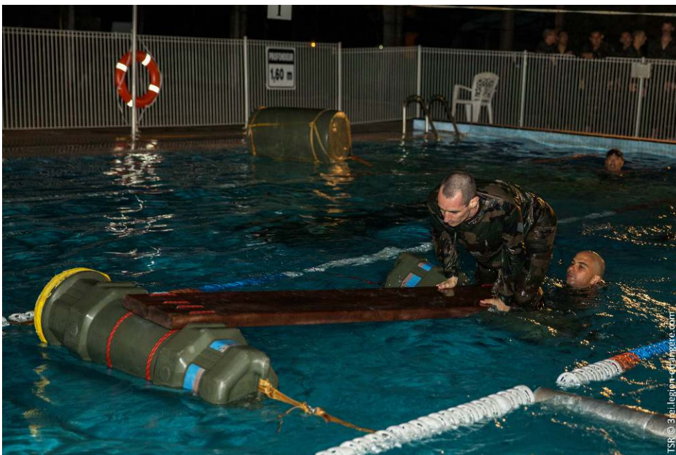
Photo 2 : séance de piscine de nuit pour se mettre dans l'ambiance...

que j'avais plusieurs intérêts précis à vouloir le faire. J'espérais y répondre, au moins partiellement, à trois questions principales. La première concernait l'aspect militaire. L'Amazonie est une région qui n'échappe pas aux intérêts géostratégiques, mais elle impose d'énormes contraintes à l'action militaire. Connaître les modes d'actions me permettrait-il de mieux comprendre les stratégies des différents pays, en particulier du Brésil, les modes de déploiement des effectifs et d'une manière générale de mieux en cerner les enjeux ? La seconde visait à comparer les techniques qui seraient enseignées, en particulier concernant la vie dans la forêt et la survie, avec ce que j'avais pu voir dans d'autres cadres, en particulier chez les Amérindiens. La troisième, enfin, tournait autour de l'aspect technique. Pouvais-je trouver dans ce qui serait enseigné des éléments qui me seraient utiles pour l'organisation de nouvelles expéditions ? Bon, le challenge personnel n'était pas non plus exclu de l'histoire, il faut aussi l'avouer.