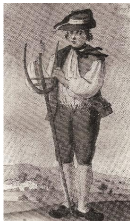
Paysan suisse par Dulaure, pluviôse an II 27

À l'époque du Thermomètre du jour , Dulaure avait relaté quelques nouvelles de Genève, et notamment la fête en hommage à Rousseau qui y avait été célébrée le 30 juin 1793, dont le cérémonial lui avait plu 28 . Préservant son rôle de grand témoin dont il avait fait l'essence de son journalisme, il mesure maintenant de visu l'influence des événements français à Genève, notamment à l'occasion de la fête-anniversaire de la révolution genevoise à laquelle il assiste le 8 nivôse an II (29 décembre) :