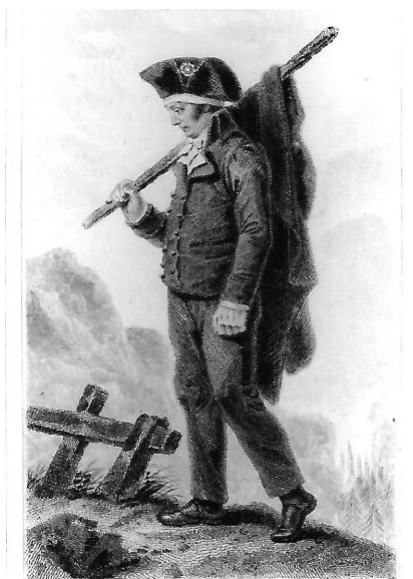
Portrait del Comte, fils de Dulaure, 1783 J. A. DULAURE, DÉPUTÉ, avec bois de lui se reposant en chemin, en 1783

[...] J'abandonnai le projet de partir en marchand de parapluie, et formai celui de voyager comme un marchand peu riche. Je fis faire mon costume en conséquence. Un pantalon d'espagnolette, vert bouteille très foncé, avec le gilet de même, des demi guêtres en drap noir, une vaste redingote bleue, rapiécée et retournée, un chapeau déchiré, une perruque, un gros bonnet de laine grise, de gros gants gris, trois chemises sans être garnies, deux mouchoirs bleus à mouches assez communs, que je fis acheter exprès, voilà en quoi consistait mon équipement de voyage » 21 .