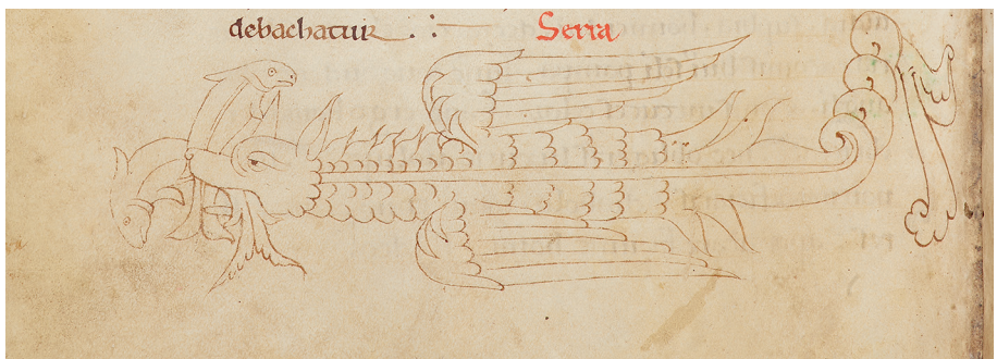
Fig. 4 – Manuscrit Oxford, Bodl. Lib., Laud. Misc. 247, f. 141v