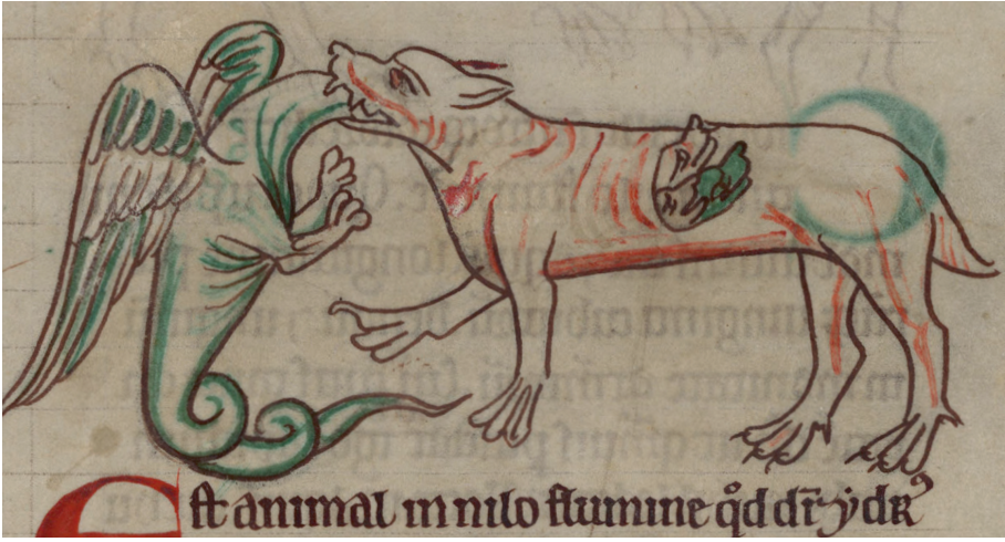
Fig. 1 – Manuscrit Cambridge, Corpus Christi College 22, f. 162r