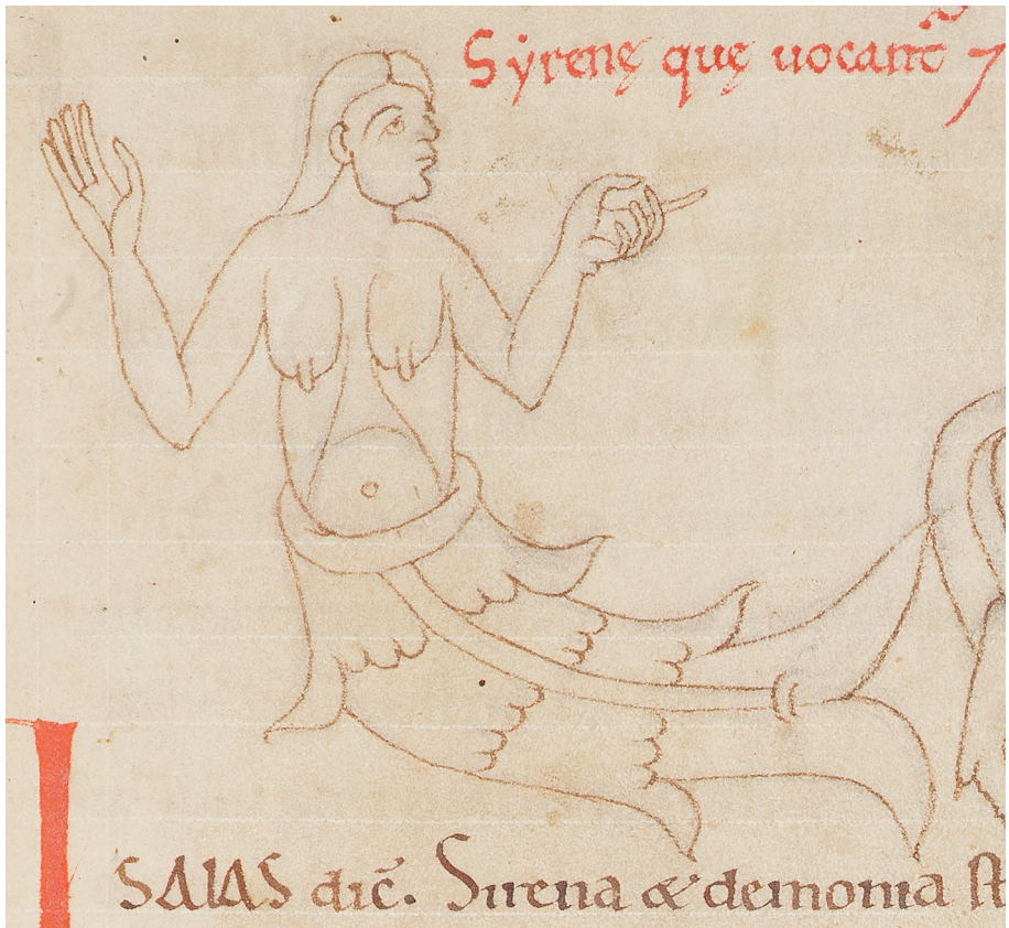
Fig. 3 – Manuscrit Oxford, Bodl. Lib., Laud. Misc. 247, f. 147r