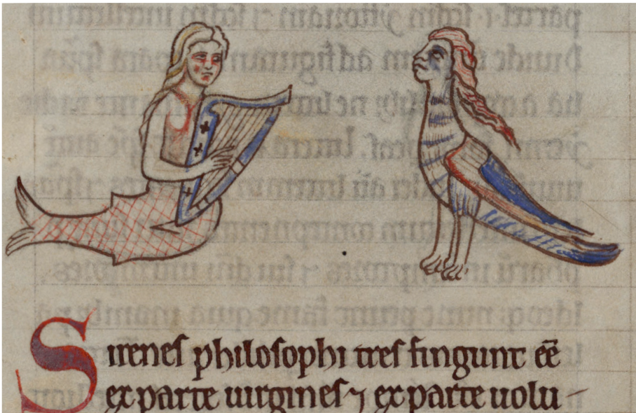
Fig. 2 – Manuscrit Cambridge, Corpus Christi College 22, f. 167v