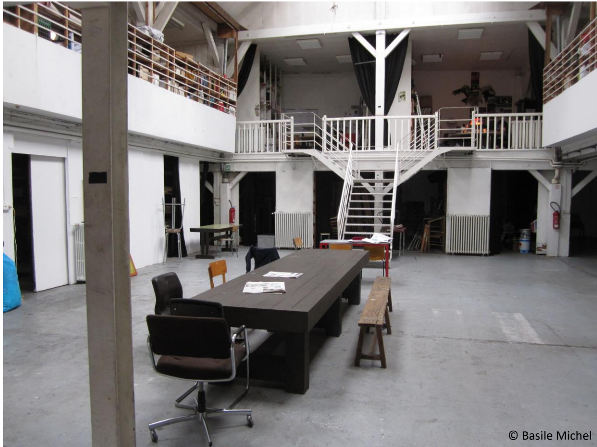
Figure 3. Espace mutualisé combinant les fonctions d'administration, de création et de diffusion artistique