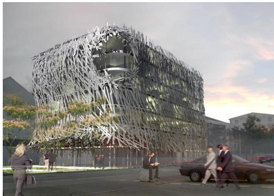
Perspective d'un projet d'immeuble de bureaux (Agence Tetrarc)

médias (accueillant notamment le quotidien Presse-Océan et les télé nantaises). 3 projets d'immeubles d'entreprises (Coupechoux/Tetrarc, Euréka médias et Forma 6) étaient très avancés début 2008 dans leur montage opérationnel.