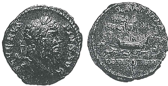
Fig. 1. Monnaie de Septime Sévère portant au revers un navire dans le Grand Cirque accompagné de la légende LAETITIA TEMPORVM ( RIC , IV, 1, 125, n° 174, pl. 7.10).