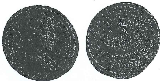
Fig. 2. Monnaie de Caracalla portant au revers un navire dans le Grand Cirque accompagné de la légende LAETITIA TEMPORVM (Hill 1964, pl. XV, 4).