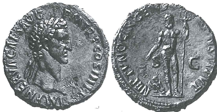
Fig. 6. Monnaie de Nerva montrant au revers Neptune accompagné de la légende NEPTVNO CIRCENS. CONSTITVTI. SC ( BMC , III, n° 132).

frumentationes . Prolongeant les conclusions de J. Beaujeu, S. Tramonti et A. Arnaldi 82 en concluent que les ludi Neptunales ou Neptunalici , jeux annuels connus par des sources plus tardives 83 , furent créés par Nerva. Le but de ces jeux était de rendre Neptune favorable à la navigation des navires de charge et donc à l'approvisionnement en blé de Rome. Par conséquent, la présence de Consus sur la monnaie de Nerva paraît particulièrement appropriée 84 . Consus, déjà identifié à Poséidon Hippios comme dieu chtonien, pouvait être non assimilé, car leurs attributions restent bien distinctes, mais rapproché du dieu des mers Neptune-Poséidon, non seulement en raison de leur assimilation à la même divinité, mais surtout grâce à leurs rôles respectifs dans l'approvisionnement de Rome et de leur commune présence au Grand Cirque.