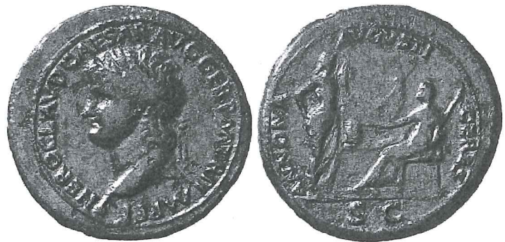
Fig. 5. Monnaie de Néron montrant au revers Annona et Cérès devant une proue de navire avec la légende ANNONA AVGVSTI CERES ( BMC V, n° 305).

On peut penser d'abord à son utilisation pour célébrer l' adventus du Prince. De fait, Septime Sévère, en 202, célébrait aussi son retour d'Orient 68 et des monnaies portant un navire à leur revers furent frappées à cette occasion 69 . Bien que l'Empereur fût en réalité essentiellement revenu par voie de terre, une allusion à son heureux retour par le décor naval du Cirque est donc assez plausible, du moins pour une première édition du spectacle, lors des décennales. Mais un autre usage du navire comme motif monétaire apporte des éléments d'interprétation chargés d'une symbolique plus profonde. Il s'agit de son association à des légendes célébrant le bon approvisionnement de Rome, grâce à l'heureuse traversée des navires de l'annone 70 . Sur les monnaies évoquant ce thème, on trouve aussi, outre Cérès ou Annona (fig. 5), des divinités protectrices de la navigation, en particulier Neptune. C'est le cas par exemple sur des monnaies de Marc Aurèle 71 , où le dieu de la mer apparaît à côté de Cérès.