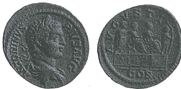
Fig. 4. Monnaie de Caracalla montrant au revers Septime Sévère et ses deux fils avec la légende AUGVSTI COS. (Hill 1964, pl. XV, 2).