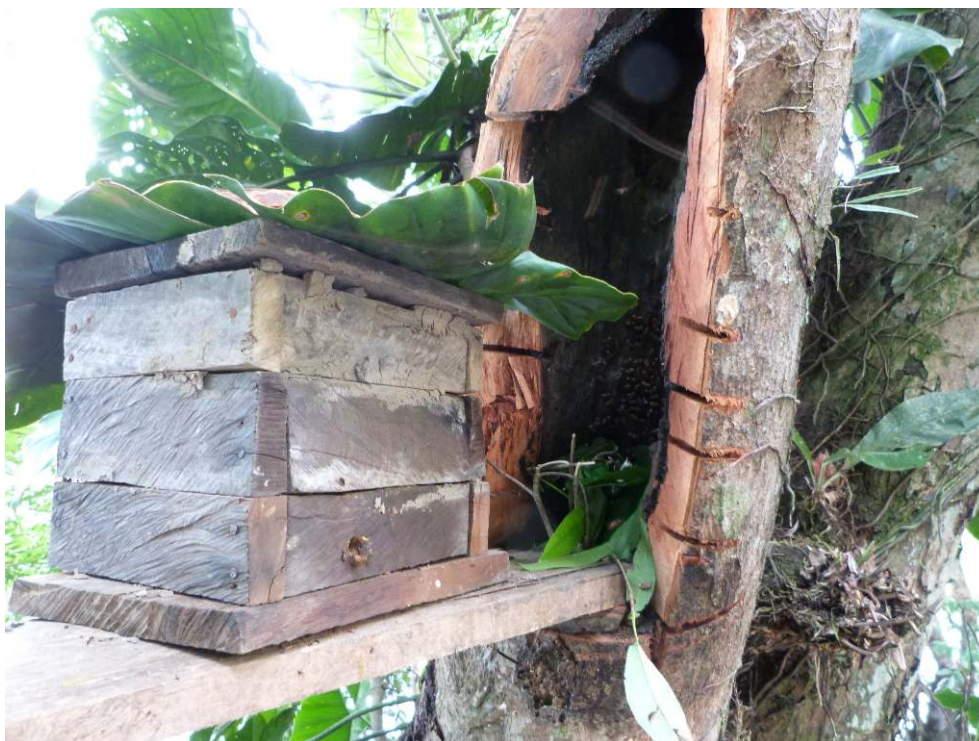
Photographie 4. Une colonie enruchée sur le site de l'extraction, le tronc de l'arbre dans lequel le nid était bâti, porte des entailles faites à la tronçonneuse et à la machette