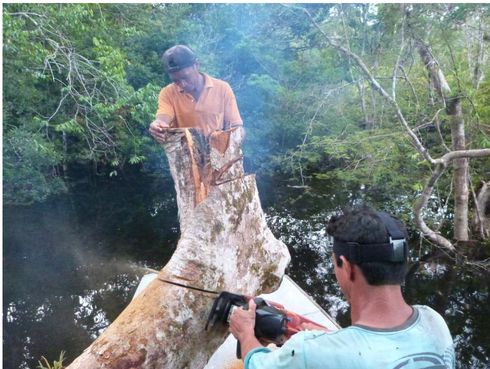
Photographie 1. Coupe d'une section de tronc logeant une cavité occupée par une colonie de mélipones