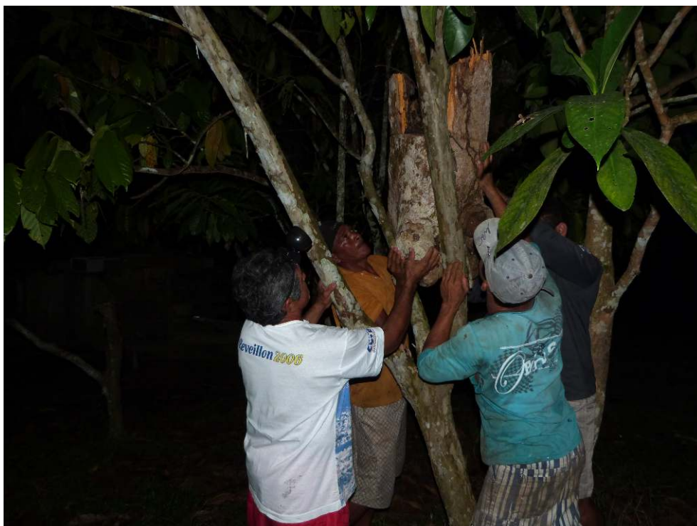
Photographie 2. Installation dans le jardin de l'éleveur de mélipones, de la section de tronc logeant la colonie d'abeilles