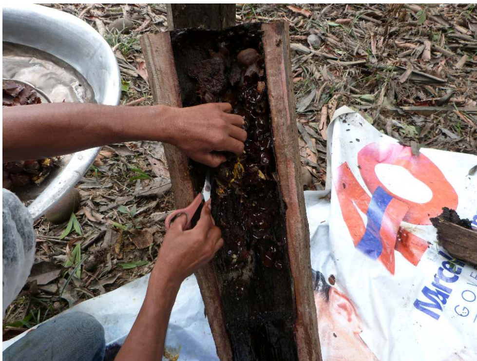
Photographie 3. Extraction d'un nid de mélipones en vue de son transvasement dans une ruche divisible