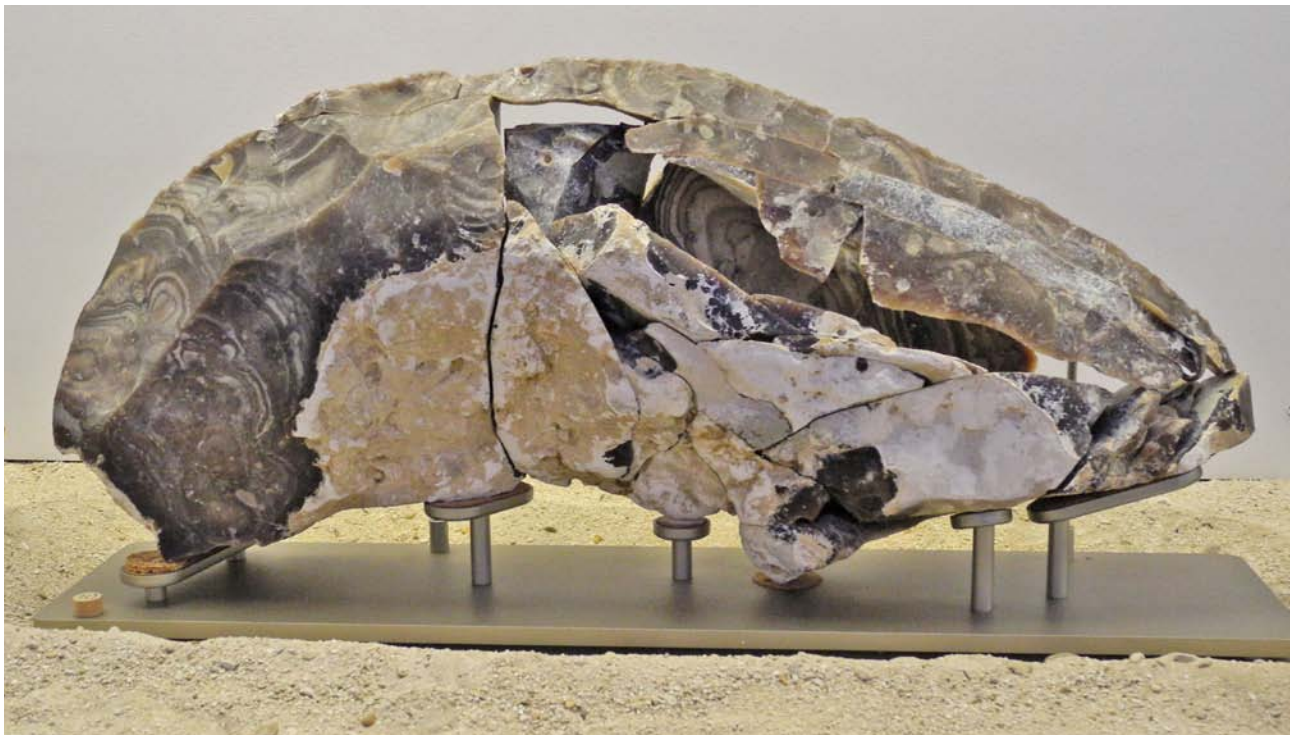
Musée de Préhistoire d'Ile-de-France, Nemours

4. AU PALÉOLITHIQUE SUPÉRIEUR , on confectionnait la plupart des outils dans des lames obtenues à partir d'un bloc de pierre, nommé nucléus. Le nucléus ci-dessus, qui provient du site d'Étiolles, dans l'Essonne, a pu être reconstitué à la façon d'un puzzle. Il mesure plus