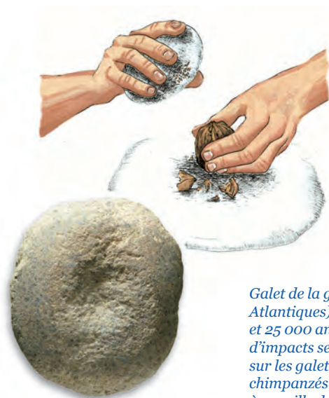
Galet de la grotte d'Isturitz (Pyrénées-Atlantiques) daté entre 30 000 et 25 000 ans portant des traces d'impacts semblables à celles visibles sur les galets utilisés par certains chimpanzés pour concasser des fruits à coquille dure (Sophie A. de Beaune).

l'on en croit les dernières découvertes (5).