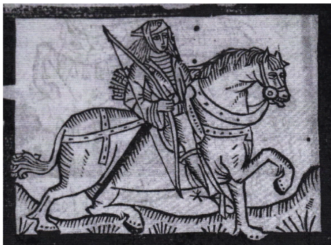
Le yeoman de Robert Pynson (1492)