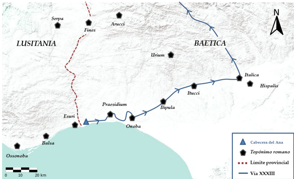
Figura 7. Trazado de la vía XXIII (según propuesta del autor) y ubicación de los topónimos citados (autor).

vio y tampoco dio texto. Dadas las pautas de amojonamiento bético (España-Chamorro 2018a y, especialmente, 2019b e/p), es bastante improbable que pudiese haber cualquier tipo de inscripción miliaria en toda esta área.