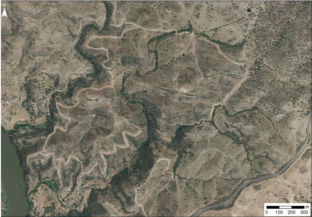
Figura 3. Ubicación de parte del trazado de las infraestructuras del siglo XIX. Imagen elaborada a partir de las ortofotos de PNOA-2016 al norte de Sanlúcar del Guadiana (la carretera que se ve es HU-4402, lat. 37° 29' 39.16", lon. 7° 26' 39.28").

Guadiana a través de una línea férrea de 35 km, como en el proyecto anterior. Eso permitiría comunicar la mina con el puerto fluvial de Sanlúcar del Guadiana. Las obras se iniciaron simultáneamente tanto en la mina como en el río, las cuales, no sin falta de problemas, siguieron ejecutándose hasta el 31 de julio de 1876, cuando la sociedad decidió renunciar al proyecto por falta de capital ( vid. Carrasco Martiáñez, 2015: 80-87). Se sucederían algunas propuestas ulteriores, las cuales no llegaron a nada. Los restos monumentales no se corresponden con la preparación de una vía romana, sino con el basamento de la estructura viaria del ferrocarril, que llevaba directamente a Sanlúcar. Como indica N. de la O Vidal (2001: 293 y ss.), no hubo un intento de explotación minera en la zona, sino que hubo ni más ni menos que cuatro o cinco, de los cuales el único que llegó a materializarse, aunque de manera inacabada (fig. 3), fue el de la compañía londinense. Su trayecto se ve perfectamente expuesto en el plano propuesto (fig. 4). Los argumentos de J. M. Ruiz Acebedo declinaban la balanza del trazado de la vía XXIII por esta zona, ya que lo vinculaban a restos de infraestructuras viarias de considerable envergadura. Una vez descartada esta hipótesis, es necesario replantear de nuevo la cuestión. Sin intención de hacer cíclica la historia, veo más plausible pensar en un itinerario costero al estilo del que prospectó y propuso P. Sillières (1990: 330 y ss.).