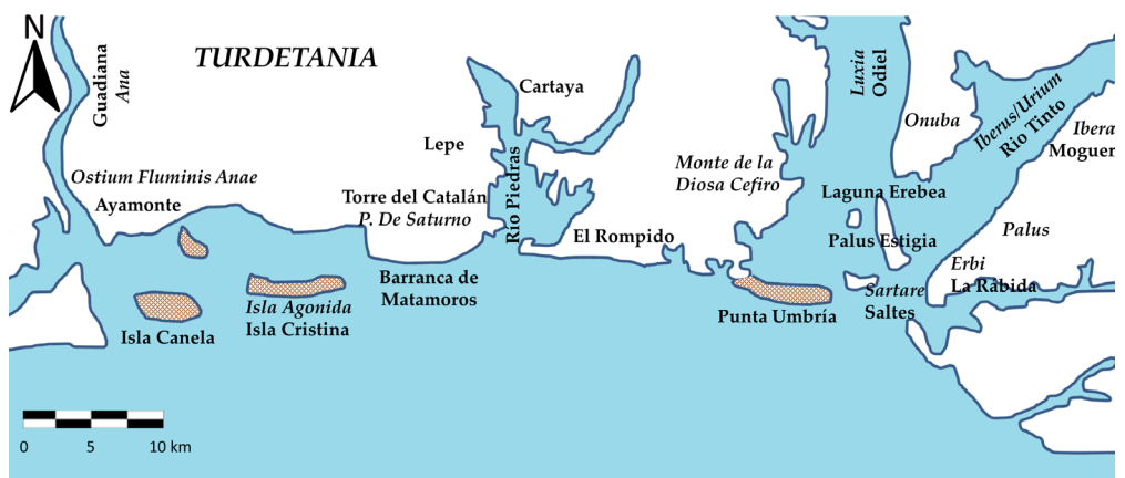
Figura 6. Morfología de la paleocosta onubense en época prerromana-romana (autor, implementando la propuesta de L. López, 1990: 20, fig. 1).

Los defensores del trazado interior sitúan esta mansio en Sanlúcar del Guadiana, pueblo que está presidido por un castillo moderno que sería el lugar para el destacamento