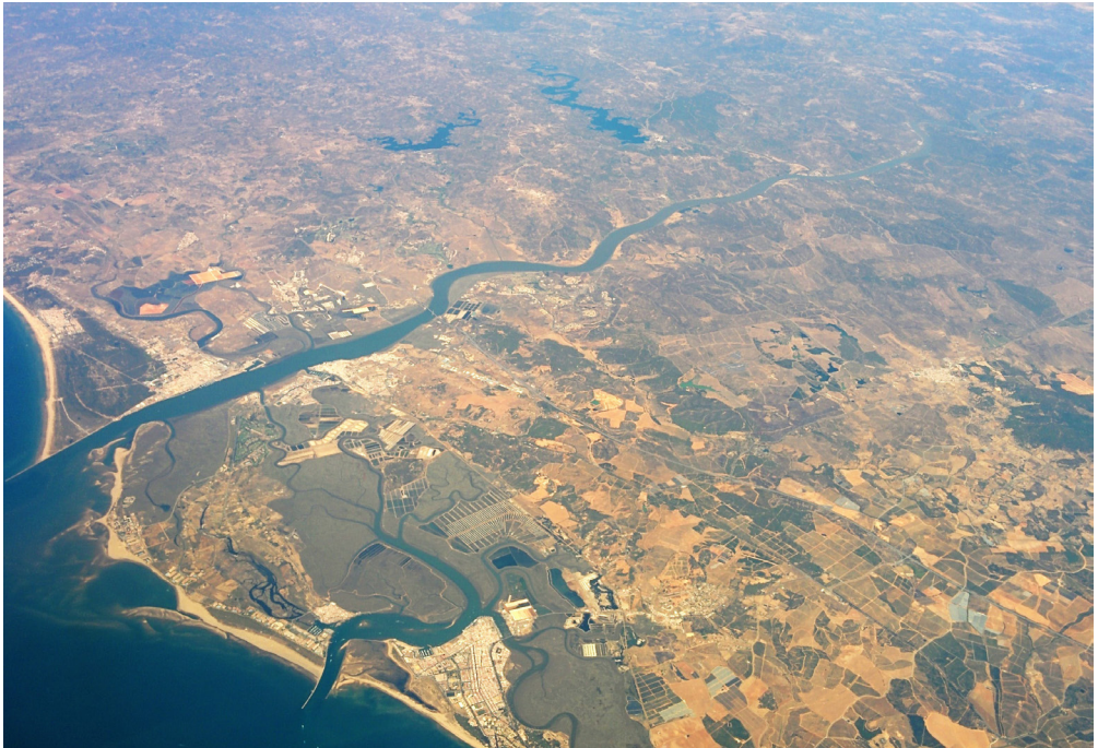
Figura 1. Foto desde satélite de la desembocadura del río Ana (Guadiana).

El tramo que ha creado la mayor polémica es aquel entre la cabecera del río Ana y la ciudad de Onoba , que además coincide con la parte que varía en la incorporación a un conventus o a otro. Las ulteriores mansiones no serán objeto de debate por no centrarse en el problema principal y estar mayoritariamente bien ubicadas.