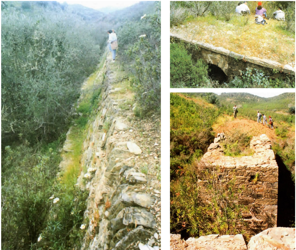
Figura 2. Infraestructuras de la plataforma y obras de infraestructura del ferrocarril (Ruiz Acevedo 1998: 142-143, láms. 3 a 5).

ferrocarril en Riotinto por D. Joaquín Ezquerro (autorizado en 1853, aunque no llegó nunca a realizarse), pero matizó que este proyecto no habría pasado en la zona de Cabezo de los Estandartes (lugar donde se indica la estructura monumental), ya que no existen evidencias de explotación minera que lo hiciesen necesario, puesto que la vía XXIII se abandonaría tras la Edad Media.