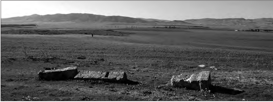
Fig. 3: La pianura del Krib. In primo piano il Fundus Turris Rutundae .

prietà imperiale in una di queste pianure è il fundus Turris Rutundae di cui si è parlato supra , sito nella larga pianura del Krib 41 (fig. 3), a undici chilometri dalle proprietà imperiali delle zone accidentate dove la lex Hadriana è stata recentemente ritrovata. La dedica per il restauro d'un tempio a Caelestis posta da coloni imperiali rappresentati da un magister mediante un sacerdote, ci fa intravedere una comunità che, da un lato, è assai ricca e centralizzata per costruire e mantenere in buono stato dei templi e possedere uno spazio monumentale 42 e, dall'altro, presenta un'organizzazione complessa con delle cariche religiose, diversamente da quanto si conosce per ora dei coloni imperiali dove è in vigore la lex Hadriana o suoi adattamenti 43 .