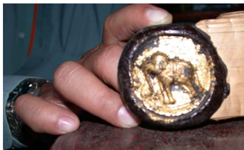
Figure n° 8 : sceau d'un édit retrouvé dans la province de Phongsaly, XIX e siècle

Il n'est alors pas surprenant que dès le début de la période française, les rois du Laos aient utilisé un tampon moderne pour authentifier les documents qu'ils produisaient. Les motifs de l'iconographie ancienne trouvèrent ainsi une nouvelle vie. Éléphants et parasols ornèrent également les drapeaux et les armoiries et furent même sculptés sur les façades de certains bâtiments prestigieux. La révolution de 1975 remplaça bien sûr ces symboles jugés archaïques et rétrogrades par de nouveaux modèles en phase avec l'idéologie communiste : roue dentée symbolisant l'industrialisation ; épis et rizières illustrant une agriculture supposée prospère ; route, cours d'eau et barrage mis en perspective pour mieux mettre en évidence l'élan vers le progrès. Cette iconographie récente ne semble toutefois pas avoir gagné complètement les esprits. Il est manifeste, depuis une dizaine d'années, que certains motifs traditionnels illustrant les valeurs séculaires du Laos sont désormais