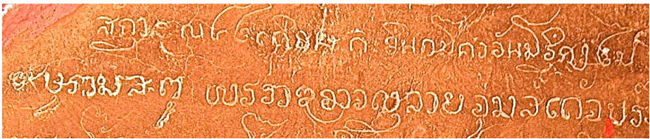
Figure n° 3 : détail de la stèle inscrite du Vat Xieng Men, Luang Prabang, 1590

coïncide avec le moment où Setthāthirāt, après avoir régné pendant plusieurs années sur la partie septentrionale du Lān Nā (il a dû résider à Chiang Saen jusque vers 1559) en même temps que sur le Lān Xāng, s'établit de façon effective et définitive dans cette partie de la vallée du Mékong, à plus de 400 kilomètres en aval de Luang Prabang, pour essayer d'échapper à la menace birmane. La partie introductive des stèles érigées sur les domaines des nouveaux temples présente, de la même façon que pour les inscriptions antérieures du Lān Nā, des données calendaires précises, une formule propitiatoire et la mention explicite d'une ordonnance royale ( phra rājā ātīnā ). Le caractère particulier de cette dernière est toutefois « appuyé » par ces deux nouveaux mots, « lāy » et « cum », qui introduisent ici l'idée d'une certification (cf. fig. n° 3).