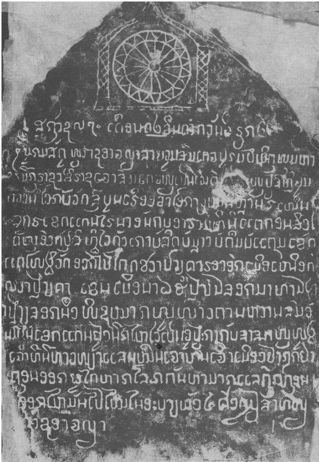
Figure n° 6 : stèle inscrite du Vat Si Bun Huang, Nong Khai, 1608

réalisation de la figure est alors laissée à un spécialiste qui laisse peut-être dans son œuvre des indices permettant son authentification. Bien que les caractéristiques générales de ce sceau subsistent apparemment pendant plus de trois siècles, des variantes sont tout de même notables, autorisant une classification à l'intérieur de périodes assez bien définies (1541-1663 ; 1735-1800 ; 1805-1828 ; 1828-1853), mais également de groupes qui se distinguent par une différence d'origine (Vientiane, Luang Prabang, Xieng Khuang). Le motif principal est d'abord la roue, puis la fleur. Au centre de ce motif, il apparaît que l'on a représenté à plusieurs reprises une figure animale qui est peut-être un oiseau, voire un éléphant vu de profil ( cf. infra ).