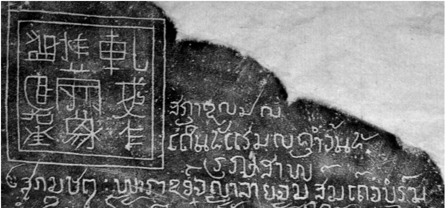
Figure n° 1 : détail de la stèle inscrite de Don Hon (1577)