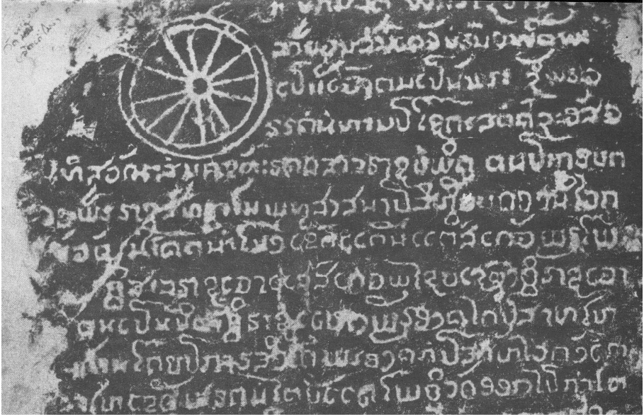
Figure n° 4 : détail de la stèle inscrite du Vat Phra Ngam Nam Mong, Tha Bo, vers 1590

moyeu, deux disques en bordure figurant la jante, ainsi que douze rayons remplissant l'espace intermédiaire (cf. fig. n° 4).