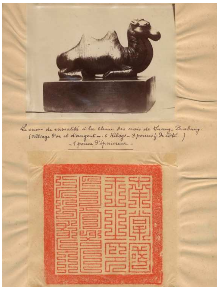
Figure n° 2 : sceau chinois (Qing) donné au roi de Luang Prabang

C'est donc probablement ce même sceau, puisque la question de cet important insigne n'est plus abordée par la suite, qui fut offert soixante-dix ans plus tard à Auguste Pavie.