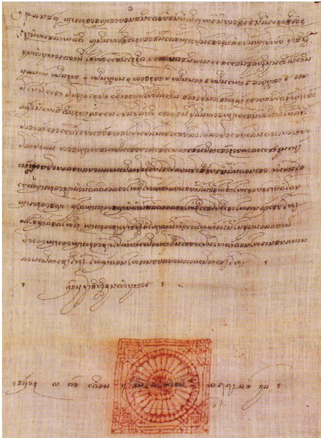
Figure n° 5 : charte royale (kongdin) datée de 1647

Leur support particulier (des bandes d'étoffe), leur taille (un manuscrit atteint la longueur de 5,84 m pour une largeur de 41 cm, un autre atteint la largeur de 99 cm), leur esthétique particulière et bien entendu leur contenu font de ces textes des témoignages tout à fait exceptionnels (cf. fig. n° 5). Il s'agit en réalité de « kongdin », c'est-à-dire de chartes territoriales adressées par les souverains de Vientiane, Luang Prabang et Xieng Khuang à des gouverneurs locaux (Sam Nua, Sam Tai, Muang Soy, Muang Sop Et, etc.) pour avaliser la liste des lieux servant de repères à la délimitation des frontières. Un très grand nombre de toponymes désignant des réalités géographiques, telles que des reliefs ou des cours d'eau, sont ainsi mentionnés. La plus ancienne de ces chartes semble bien dater de l'année