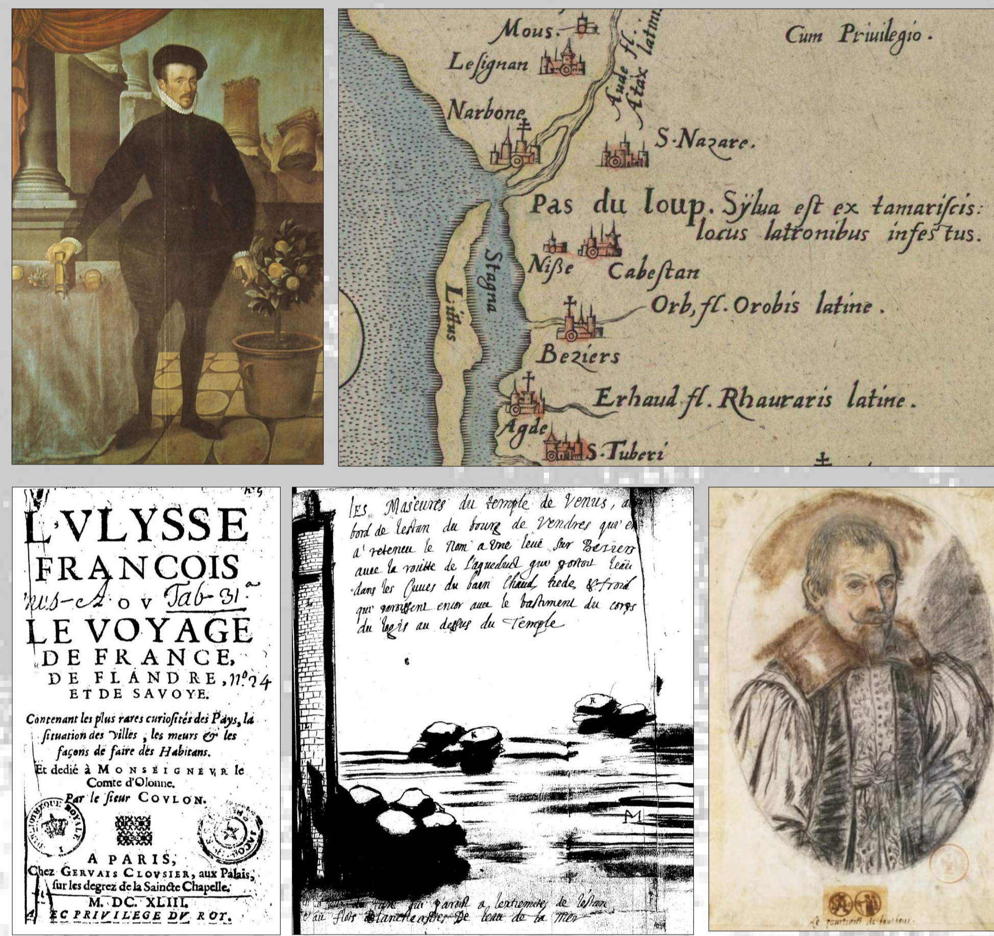
Portrait de Félix Platter (1584), extrait de la carte de Languedoc d'Abraham Ortelius (1570), extraits du manuscrit Récit des Anciens Monuments qui paroissent encore en Première et Seconde Narbonnaise , temple de Vénus et portrait de l'auteur, Anne de Rulman (1628).

Dans une période de déchirement religieux et de contestation de l'ordre royal, dans des paysages désormais laïcs et anthropocentriques, les ruines antiques métaphorisent vraisemblablement pour les hommes de la fin de la Renaissance une quête de paix civile et de concorde.