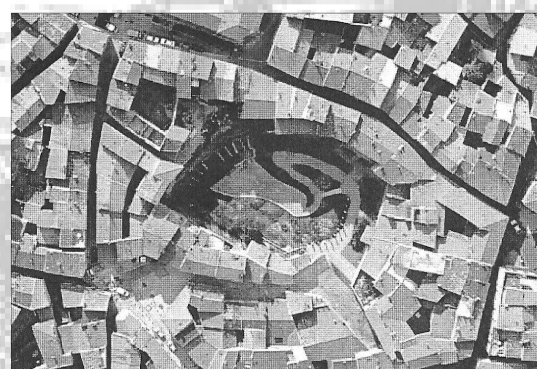
Fossilisation de la matrice de l'amphithéâtre à Béziers dans le parcellaire urbain, et vue actuelle de l'amphithéâtre

Les paysages ruraux conservent la mémoire des matrices cadastrales antiques. La trame viarie, l'implantation de sites viticoles actuels sur des villas antiques, la présence même de la voie Domitienne témoignent de la fossilisation des grandes opérations d'arpentage menées par Rome.