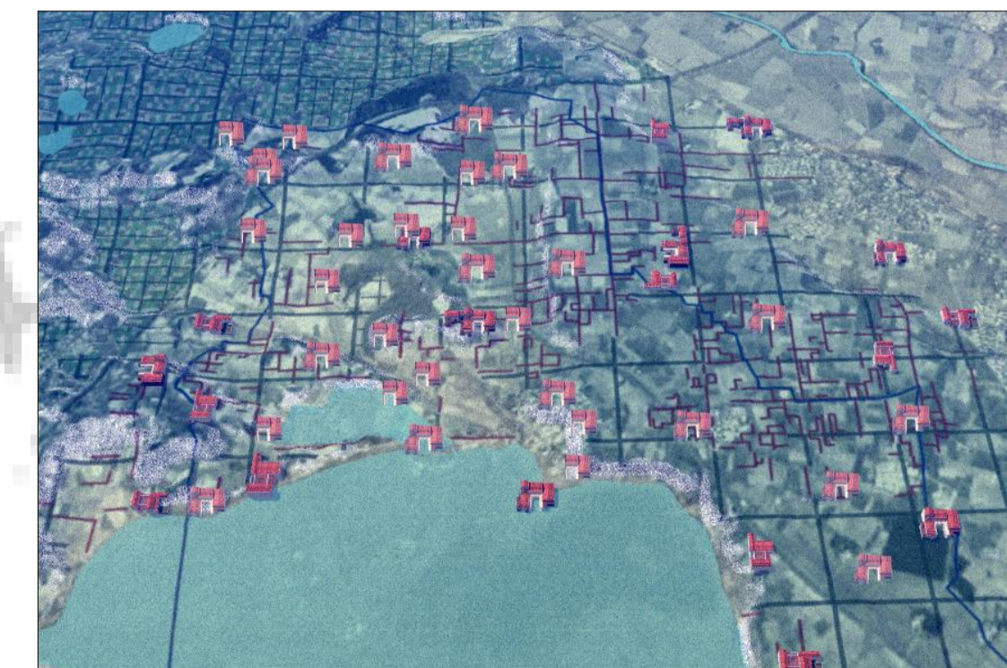
Fossilisation du réseau centurié Béziers A et des villas antiques autour de l'étang de Vendres, et vue actuelle du site dit Temple de Vénus à Vendres.

L'étude du corpus de textes techniques et juridiques des arpenteurs romains, les gromatiques, valide l'héritage de formes planimétriques antiques telles que les centuriations, tout en questionnant la dynamique de cet héritage dans les morphologies paysagères actuelles. Les survivances des cadastres anciens confèrent aux paysages biterrois une valeur patrimoniale.