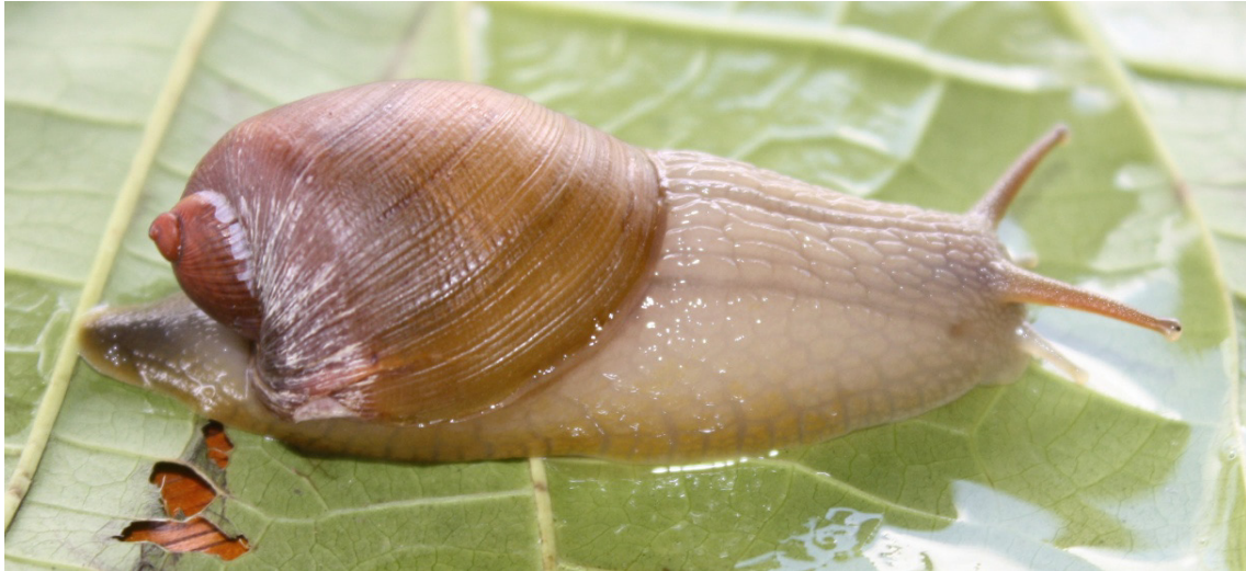
Figure 2 : vue du spécimen vivant d'ambrette capuchon de Marie-Galante (photo A. Lenoble, publiée sous licence creative commons BY-SA 4.0).

C'est donc sur une distance d'un peu plus d'un kilomètre, dans le segment le plus bas de la ravine Bonnet, qu'ont été rencontrées les coquilles à périostracum et le spécimen vivant témoignant de la persistance d'une population d'ambrette capuchon à Marie-Galante. Aucun spécimen n'a autrement été rencontré dans les autres parties du cheminement réalisé (sentier des sources et affluent méridional de la ravine Bonnet), ni lors des autres cheminements réalisés le jour suivant (coulée Cobelet et ravine Verpret). Une fois collecté et documenté, le spécimen vivant a été noyé et fixé en éthanol avant d'être transmis au Muséum national d'Histoire naturelle de Paris (MNHN-IM-2013-79989). Les coquilles trouvées vides ont, quant à elles, été dévolues au Muséum d'Histoire naturelle de Bordeaux (Référence 2018.11.0).