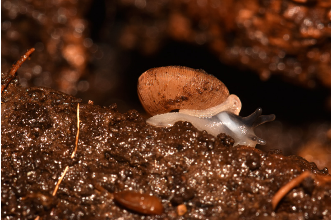
Trissexodon constrictus (Boubée 1836), Pyrénées-Atlantiques, Mai 2018, © Alain Bertrand.