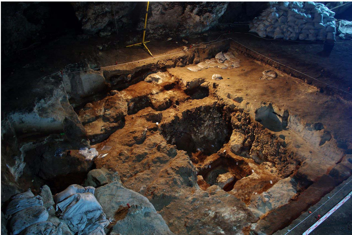
Figure 01 : CAPESTERRE-DE-MARIE-GALANTE, Grotte Blanchard. Vue de l'emprise de fouille à l'issue de la campagne 2013. La vue regarde le mur est de la cavité, l'entrée de la cavité se situant au sud. Sur cette vue, on relève la première passe de fouille ayant dégagé un éboulis et le secteur centrale au sein duquel la fouille a été approfondie.

0,5 m de côté, à maille de 1 mm. Les sédiments non tamisés ont été stockés en sacs, eux-mêmes étiquetés de façon à autoriser une exploitation ultérieure de ce matériel.