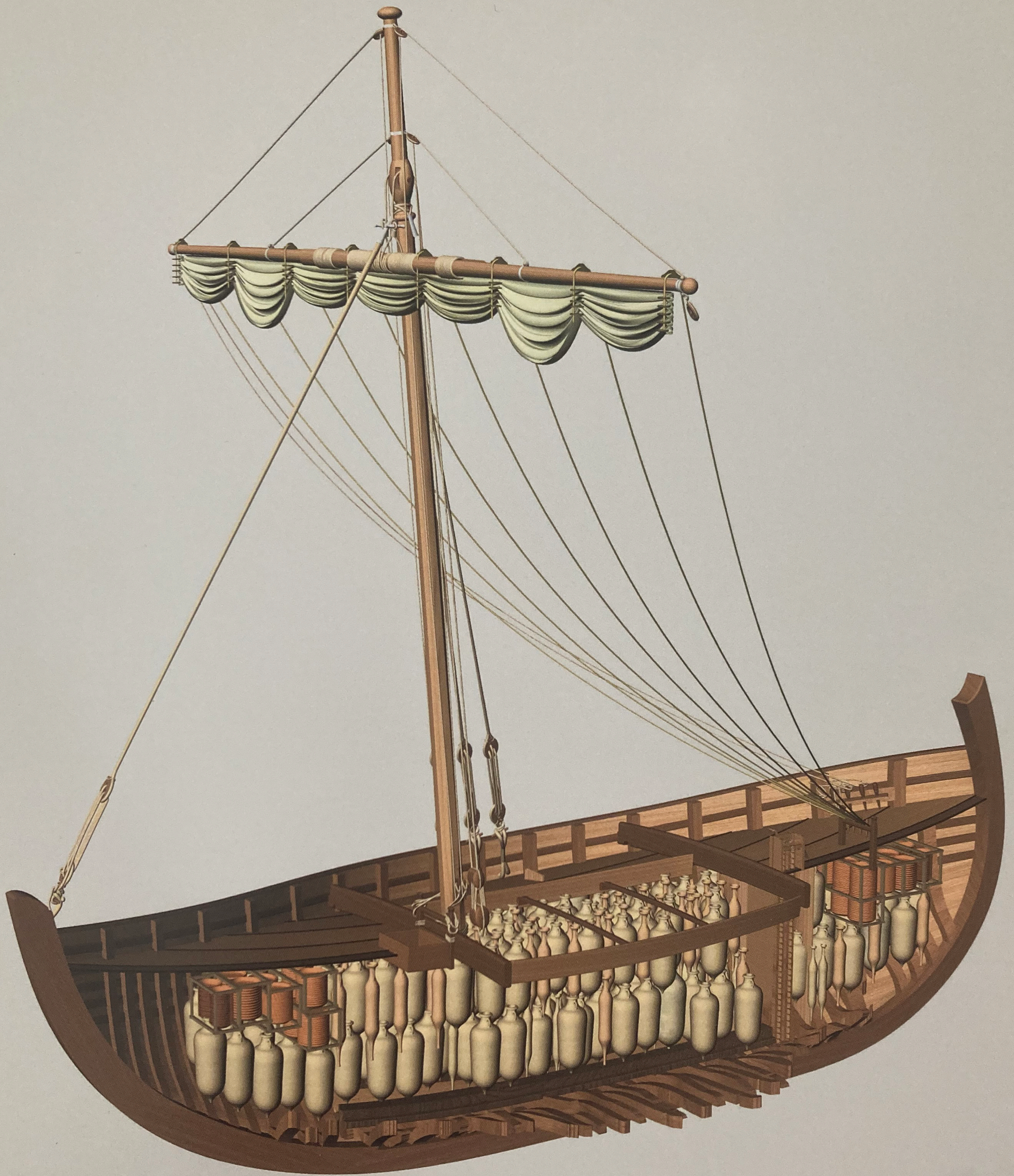
Fig. 2. Vue de trois quarts de la restitution de l'épave Dramont E.