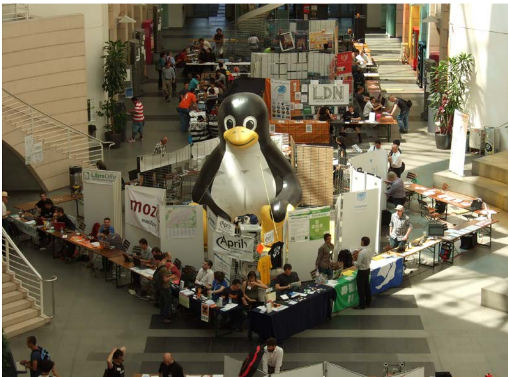
L'auteur de la photographie souhaite rester anonyme

Ça fait quoi ? Cinq ans, six ans qu'on vient ? [L'autre acquiesce de la tête.] Chaque fois c'est pareil, c'est comme un rituel. [...] C'est vraiment un moment à part. Euh... je veux dire tu vois on fait la route tous les deux, là jusqu'à Genève et on retrouve des gens qu'on connaît ou pas mais à chaque fois on peut parler geek et libre pendant une semaine. C'est un peu notre euh, notre pèlerinage à nous, enfin c'est peut-être exagéré mais ça permet de se ressourcer, de se remotiver.