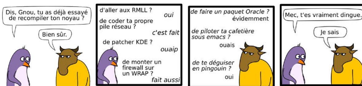
Figure 7 - Le voyage aux RMLL, pratique spatiale au coeur de l'identité libriste (Dréo, 2006)

Ce paradoxe ne va pas jusqu'à la contradiction. Si l'on suit la définition de lieu proposée par Jacques Lévy (2003b), aucune référence n'est faite à un ancrage quelconque : il s'agit d'un « espace dans lequel la distance n'est pas pertinente ». Cette définition est relative, puisque le lieu n'a de pertinence qu'au regard d'une intentionnalité, et relationnelle dans la mesure où c'est le contact qui fonde le lieu. La théorie de l'espace mobile (Retailé, 2005, 2009) fournit alors un vocabulaire