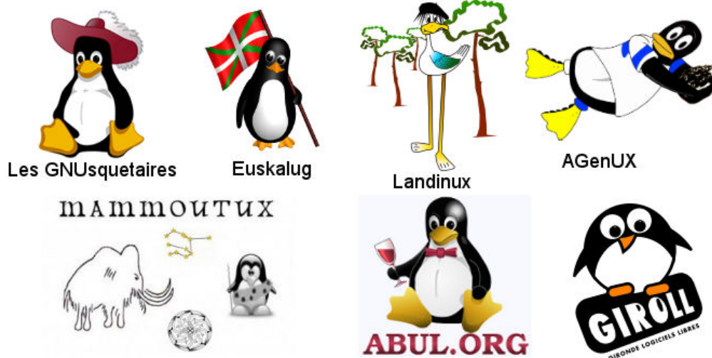
Figure 11 - Quelques logos de GULL français

Cette dimension de découverte est bien mise en avant par un organisateur, interrogé en 2010 :