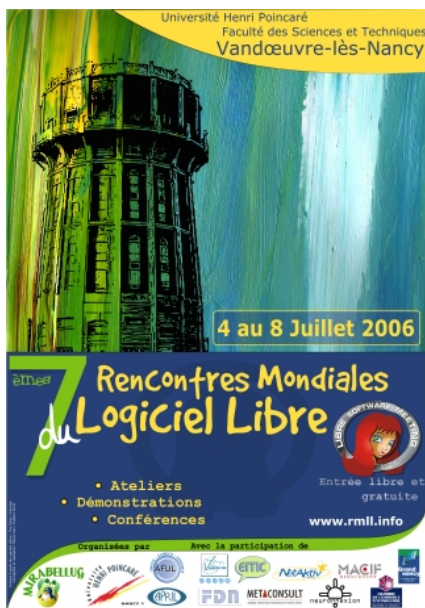
Figure 9 : Quelques affiches de RMLL

d'associations de professionnels du logiciel libre. Parfois même, il s'agit d'associations dont l'objet, tel que l'éducation populaire ou l'économie sociale et solidaire, est sans rapport direct avec les logiciels libres. Les documents de communication qu'ils produisent montrent que l'envie de voyage qu'ils tentent de faire naître chez les militants relève encore d'une logique différente : il s'agit pour eux de mettre en valeur des spécificités de la ville ou de la région d'accueil. Cette mise en scène de l'identité territoriale – qui traduit une volonté d'ancrage d'une certaine manière symétrique à la dimension de confins des RMLL déjà identifiée plus haut – se double chez certains participants d'une mise en scène similaire de leur région d'origine.