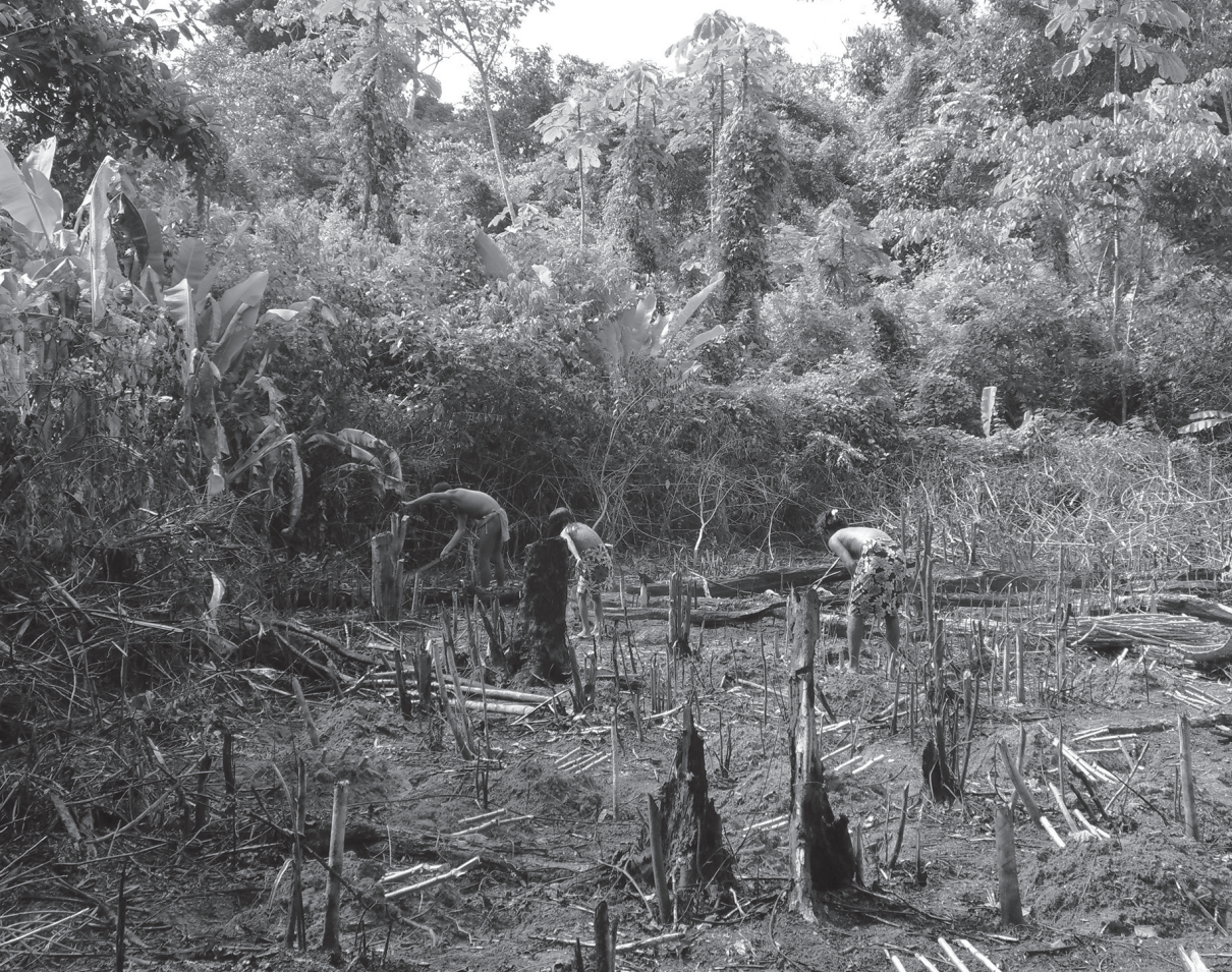
Famille wayāpi travaillant sur son abattis, village Roger, Haut-Oyapock, Guyane française (2011).

sont fréquemment renvoyés à leur altérité et font parfois l'objet de stigmatisation et de comportements xénophobes [Hidair 2008 ; Laëthier 2011].