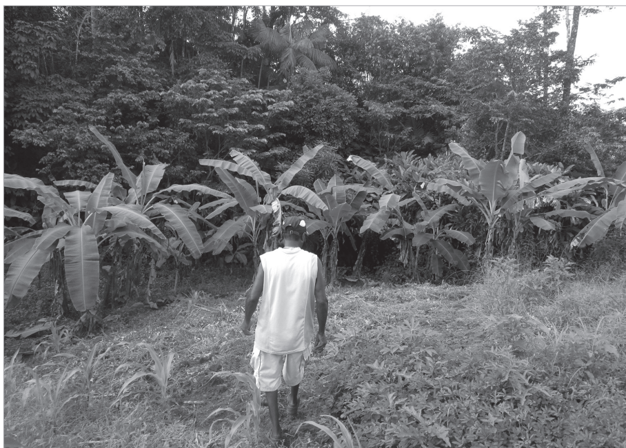
Jardin haïtien, Saint-Laurent-du-Maroni, Guyane française, 2018.

Mais plusieurs obstacles rendent l'accès à la propriété difficile. Il faut être de nationalité française ou disposer d'une carte de séjour de dix ans pour prétendre à une attribution de foncier agricole. La constitution du dossier s'avère, en outre, complexe pour des personnes n'ayant souvent qu'un faible niveau d'éducation scolaire : il faut produire une note technico-économique et la possession d'un diplôme agricole est un atout. De plus, leurs pratiques agricoles