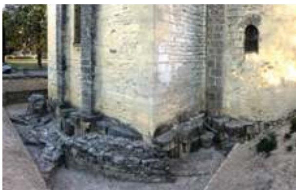
Fig. 15a-b - Les réemplois de blocs architecturaux antiques dans la fondation du chevet de la cathédrale Notre-Dame-de-Nazareth en 2016 (C. Lefebvre).

ment espacés. Cela laisse entrevoir dans les interstices une seconde rangée à deux assises également formées de réemplois disposés sur l'exemple de la première et masquée par celle-ci. La réutilisation d'éléments architecturaux s'étend donc à l'ensemble de la fondation du chevet. Cette donnée avait déjà été affirmée par J. Sautel en 1950. Cette année-là, il entreprend des sondages à l'intérieur de la cathédrale au niveau de l'abside semi-circulaire centrale. Il met au jour, sous le dallage, un niveau plus ancien correspondant à celui des fondations du chevet et constitué de réemplois d'éléments architecturaux romains identiques à ceux qui ont été dégagés à l'extérieur du monument 30 . Ces