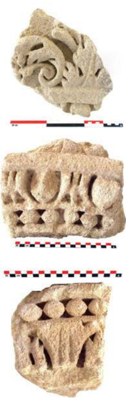
Fig. 11a-c - Trois fragments de claveaux constituant le second arc orné découvert sur le site dit « Cathédrale-Nord » (n° inv. : VAL.CATH. NORD 82.5, 82.9 et 79.3) (C. Lefebvre).

totalité de ces fragments réemployés qui peuvent ne pas appartenir au même ensemble architectural. En effet, ce type de feuille de recouvrement apparaît également sur un deuxième fragment de chapiteau corinthien (fig. 13) dont les dimensions suggèrent qu'il n'appartenait pas à une construction monumentale. Plusieurs édifices ont donc été spoliés, monumentaux ou plus modestes, et de nature publique ou bien privée (habitat ou funéraire).