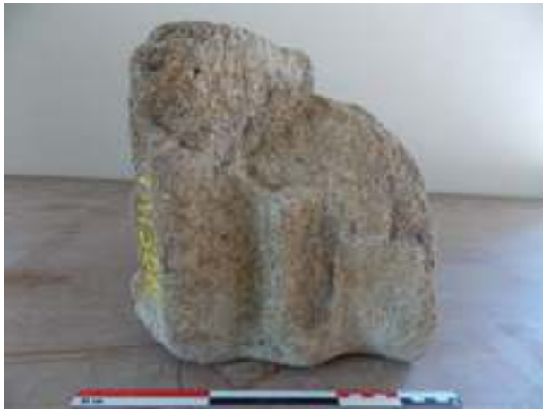
Fig. 5 - Fragment d'un fût cannelé de colonne d'une hauteur complète de 26,3 cm (n° inv. : VAI.RIV.96.25) (C. Lefebvre).