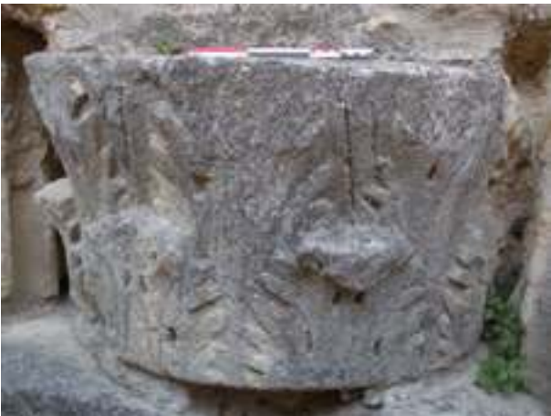
Fig. 18 - Moitié inférieure d'un chapiteau corinthien de colonne réemployé dans la fondation du chevet de la cathédrale Notre-Dame-de-Nazareth (n° inv. : VAI.CATH.09).