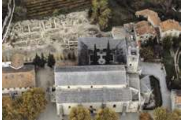
Fig. 8 – Vue aérienne du site dit « Cathédrale-Nord ». Vue depuis le sud.

Au nord-ouest du site, des sondages réalisés en 1972 et 1973 avaient permis la reconnaissance de murs datés entre le IV e et le VI e siècle (fig. 8). Au sein de ces constructions, des éléments architecturaux réemployés avaient pu être observés. La fouille de cette partie du site entre 1978 et 1980 révéla la présence d’un grand nombre de réemplois dans les blocages de fondations ou de murs, et parfois laissés visibles dans les parements de ces derniers. Certains d’entre eux sont toujours sur le