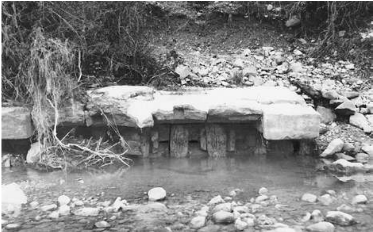
Fig. 3 - Vestiges des fondations sur pilotis de la rive gauche de l'Ouvéze en 1947.