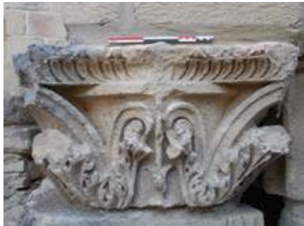
Fig. 19 - Moitié supérieure d'un chapiteau corinthien de colonne réemployé dans la fondation du chevet de la cathédrale Notre-Dame-de-Nazareth (n° inv. : VAI.CATH.06) (C. Lefebvre).

La fondation du chevet ne constitue pas le seul lieu de la cathédrale où l'on trouve des réemplois. Présents dans son élévation externe, ils sont parfois retaillés en moellons tout en conservant leur décor. Il est aisé d'identifier des fragments d'inscription, de rinceaux, d'une colonne ou d'un pilastre cannelé, etc. (fig. 20). Il apparaît également que l'orne-