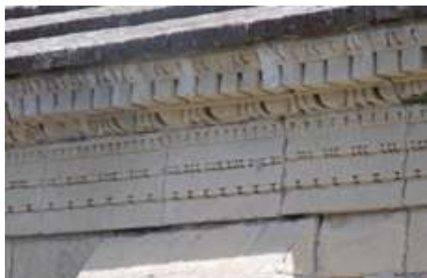
Fig. 22a-b - Détails d'est en ouest de la corniche qui orne la façade méridionale de la nef de la cathédrale Notre-Dame-de-Nazareth (détail de la corniche à l'angle sud-est de la façade méridionale ; détail de la corniche au-dessus du premier contrefort) (C. Lefebvre).