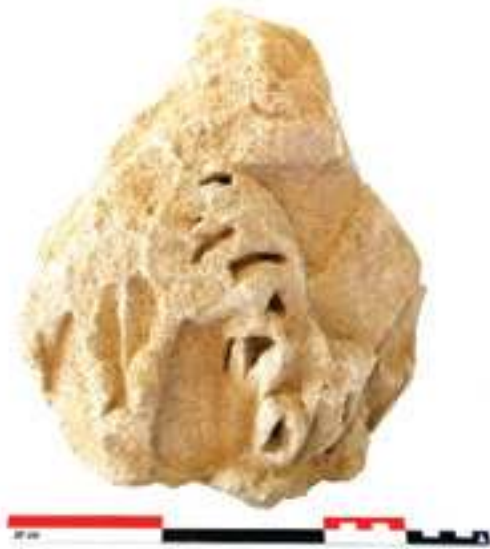
Fig. 12 - Fragment d'un chapiteau corinthien de colonne d'ordre monumental avec « Fiederblätter » (n° inv. : VAI.CATH.NORD 80 (1)) (C. Lefebvre).