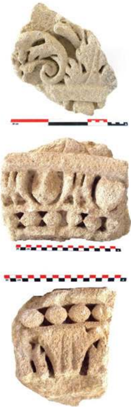
Fig. 11a-c - Trois fragments de claveaux constituant le second arc orné découvert sur le site dit « Cathédrale-Nord » (n° inv. : VAL.CATH. NORD 82.5, 82.9 et 79.3) (C. Lefebvre).

totalité de ces fragments réemployés qui peuvent ne pas appartenir au même ensemble architectural. En effet, ce type de feuille de recouvrement apparaît également sur un deuxième fragment de chapiteau corinthien (fig. 13) dont les dimensions suggèrent qu'il n'appartenait pas à une construction monumentale. Plusieurs édifices ont donc été spoliés, monumentaux ou plus modestes, et de nature publique ou bien privée (habitat ou funéraire).