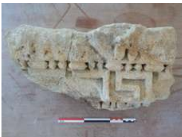
Fig. 6 - Deux fragments jointifs d'un bloc de corniche ornée à larmier (n° inv. : VAI.RIV.96.24) (C. Lefebvre).

Un des apports considérables de la fouille de 1996 est la datation livrée par l'analyse dendrochronologique des pieux en bois de la fondation du mur-digue. L'abattage du bois évalué autour de 82 impose ainsi un terminus post quem pour l'érection du mur-digue et, bien que moins précisément, un terminus ante quem pour les fragments réemployés impliquant qu'ils appartenaient à un ou plusieurs édifices déjà existants avant cette date. L'analyse typologique permet non pas d'apporter une solution mais seulement quelques précisions. Parmi les divers éléments cannelés, l'analyse a permis de distinguer deux ensembles architecturaux : cinq fragments constituent des assises de pilastres ou de piliers cannelés et quatre autres appartiennent à des fûts de colonnes cannelés dont un constitue un tambour avec une hauteur complète de 26,3 cm (fig.