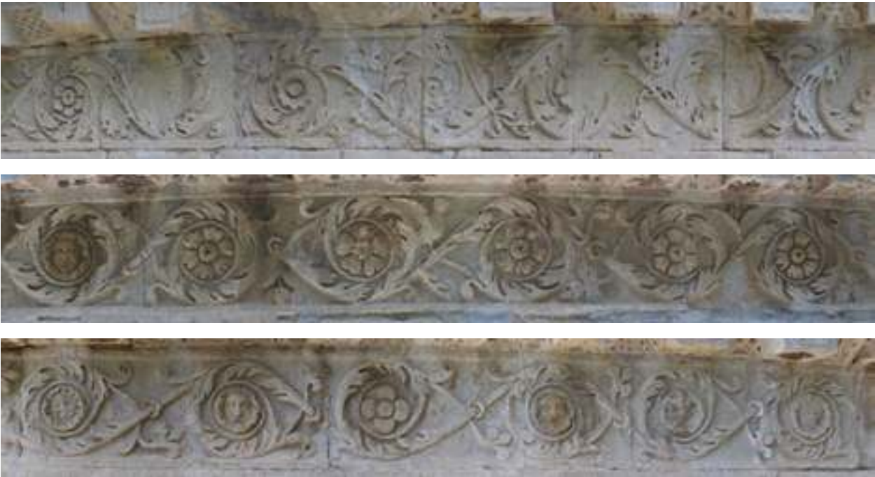
Fig. 21a-c - Détails de la frise qui orne le bas-côté méridional de la cathédrale Notre-Dame-de-Nazareth (détail de la frise entre le premier et le deuxième contrefort à compter de l'est ; détail de la frise entre le deuxième et le troisième contrefort ; détail de la frise entre le troisième et le quatrième contrefort) (C. Lefebvre).

Dans la frise du bas-côté méridional (fig. 21), à l'extrémité orientale de la façade entre les premier et deuxième contreforts, les tiges des rinceaux sont finement sculptées comme les acanthes qui les recouvrent et s'enroulent pour laisser place à des fleurons. Les tiges donnent également naissance à divers motifs végétaux dans les écoinçons laissés libres par les rinceaux. Entre les deuxième et troisième contreforts, les rinceaux perdent de leur finesse, les tiges et les feuilles s'épaississent et les écoinçons sont bien moins décorés. Les fleurons présentent un traitement plus rigide et ils sont parfois remplacés par des visages humains. À l'ouest du troisième contrefort, cette sculpture plus grossière et plus pauvre en motifs végétalisés se poursuit jusqu'à l'extrémité occidentale de la façade. Il existe donc, entre le deuxième et le troisième contrefort, un changement stylistique dû à la présence de deux ou trois types de décors. Cette différence de traitement révèle la présence d'une