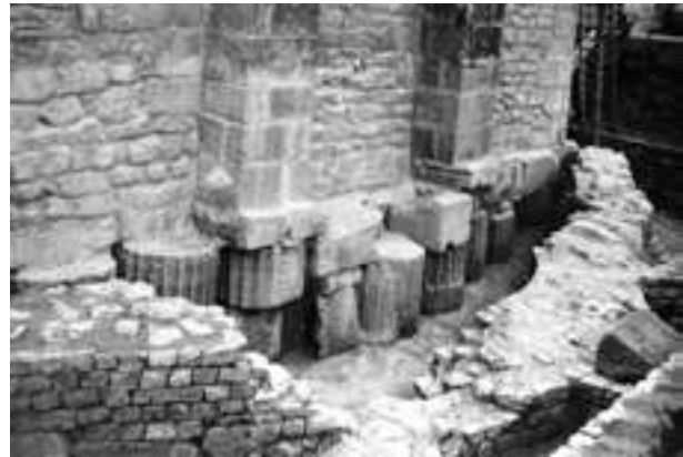
Fig. 14 - La fondation du massif du chevet de la cathédrale Notre-Dame-de-Nazareth prise à la suite de son dégagement en 1949 par le chanoine J. Sautel (fonds J. Sautel, Service du Patrimoine de Vaison-la-Romaine).

Parmi les éléments réemployés dans les fondations prennent place des pierres de taille de grand appareil aux faces taillées et lisses sans ornementation. Vingt-sept blocs d'architecture ont également été identifiés dont vingt-cinq constituent des composantes d'ordre. Deux éléments architecturaux moulurés ont été enregistrés, possible chaperon et linteau de porte, ainsi qu'un fragment de fût de colonne lisse, vingt-et-un tambours de fûts de colonne cannelés dont trois sont cannelés et rudentés, et trois moitiés de chapiteaux corinthiens (fig. 15). L'ensemble des éléments a été taillé dans le calcaire coquiller de Beaumont-du-Ventoux, principal matériau utilisé dans l'architecture monumentale de la ville dont les carrières se situent à une dizaine de kilomètres de Vaison-la-Romaine.