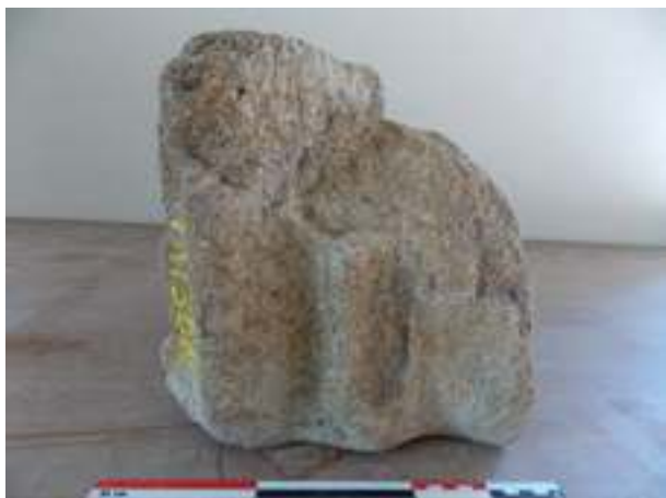
Fig. 5 - Fragment d'un fût cannelé de colonne d'une hauteur complète de 26,3 cm (n° inv. : VAI.RIV.96.25) (C. Lefebvre).