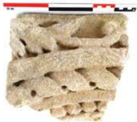
Fig. 10 – Un des quatre fragments de claveaux qui composent le premier arc orné découvert sur le site dit « Cathédrale-Nord » (n o inv. : VAI.CATH.NORD 79.14) (C. Lefebvre).

motifs végétaux assez mal conservés. Au-dessus, se développent de bas en haut une file de perles ornant un astragale, une torsade à deux brins avec œillets sans bouton ornant un second astragale et enfin le couronnement de l'archivolte qui présente de nouveaux motifs végétalisés de type rinceaux. L'astragale de perles se retrouve traditionnellement dans le vocabulaire décoratif gallo-romain employé à partir de l'époque flavienne et au II e siècle, notamment dans la seconde moitié, mais certains exemples sont déjà connus dès l'époque augustéenne 18 . Les tresses à deux brins qui ornent un astragale et présentent un profil convexe avec un œillet laissé vide entre chaque entrelacement (sans bouton), constituent une variante largement diffusée au I er siècle en Narbonnaise et particulièrement à l'époque julio-claudienne 19 . Bien que cette variante de tresse semble attestée au I er siècle, il serait imprudent de dater ces quatre fragments à partir de ce seul motif.