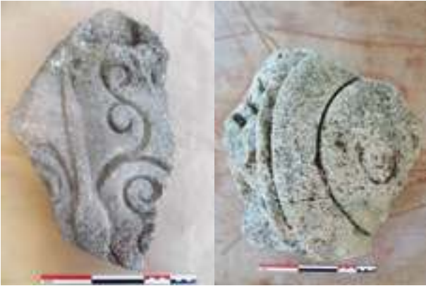
Fig. 7a-b – Deux fragments de panneaux d’armes ornés de boucliers (n° inv. : VAI.RIV.96.11 ; VAI.RIV.96.16) (C. Lefebvre).