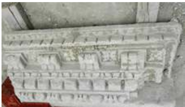
Fig. 23 – Face de parement extérieure d'un bloc de corniche du portique occidental du forum de Vaison-la-Romaine découvert en 2013 durant la première campagne de fouilles programmées sous la direction de J.-M. Mignon (C. Lefebvre).

sculpture antique et d'une sculpture médiévale et suggère le réemploi de frises à rinceaux d'époque romaine. Ce changement stylistique reste toutefois difficile à déterminer puisque l'on constate une véritable volonté des sculpteurs au Moyen-Âge à reproduire et respecter au mieux le modèle antique.