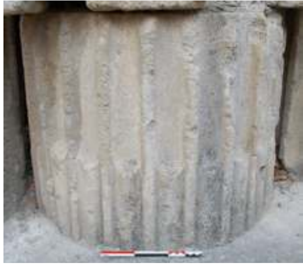
Fig. 17 - Tambour d'un fût cannelé de colonne orné de 24 cannelures partiellement rudentées et d'un diamètre de 90 cm, réemployé dans la fondation du chevet de la cathédrale Notre-Dame-de-Nazareth (n° inv. : VAI.CATH.14) (C. Lefebvre).