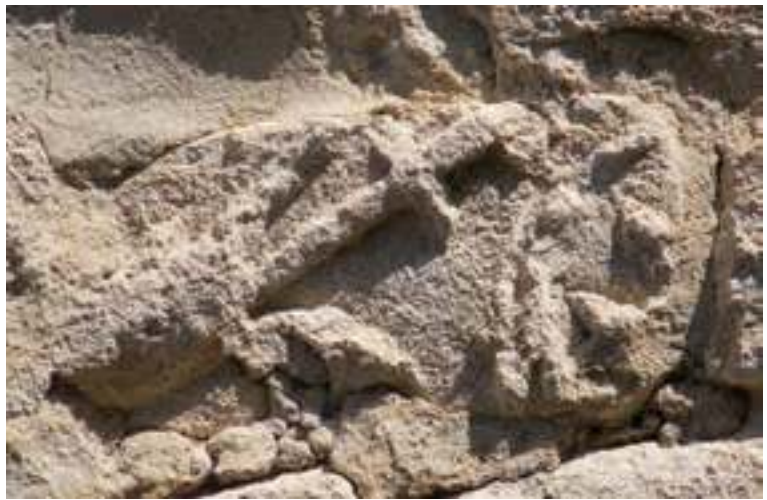
Fig. 20a-d - Réemplois divers dans les élévations extérieures de la cathédrale Notre-Dame-de-Nazareth conservés dans leur forme initiale ou retailés en moellons (C. Lefebvre).