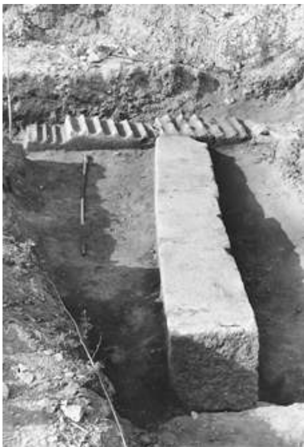
Fig. 9 – Blocs de piliers à pilastres engagés tous deux cannelés et blocs quadrangulaires lisses découverts lors des sondages de 1973 sur le site dit « Cathédrale-Nord ».

leur réemploi en un unique endroit du site et au sein d'une même structure invitent à s'intéresser à leur récupération suggérant l'idée d'un démantèlement dans le but d'une réutilisation immédiate. Malheureusement, la nature de l'édifice dont l'élévation aurait été spoliée est inconnue. En 1980, Y. Roumégoux et M.-Fr. Ribaud avaient émis l'hypothèse que les assises de piliers à pilastres engagés constituaient initialement « les pierres d'un arc monumental antique » 17 , les pilastres correspondant aux piédroits d'un arc surmontés d'impostes. Cette hypothèse ne renseigne pas sur l'identification de l'édifice dans sa globalité, mais seulement sur une partie de son architecture. Elle paraît, à nos yeux, probable et se trouve étayée par l'étude des fragments prélevés que nous avons récemment réalisée.