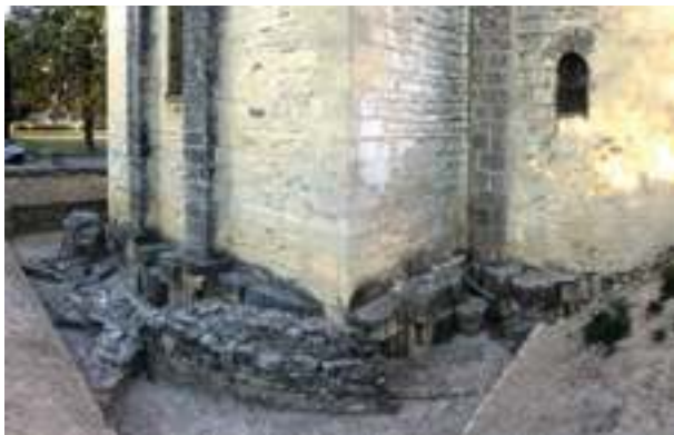
Fig. 15a-b - Les réemplois de blocs architecturaux antiques dans la fondation du chevet de la cathédrale Notre-Dame-de-Nazareth en 2016 (C. Lefebvre).

ment espacés. Cela laisse entrevoir dans les interstices une seconde rangée à deux assises également formées de réemplois disposés sur l'exemple de la première et masquée par celle-ci. La réutilisation d'éléments architecturaux s'étend donc à l'ensemble de la fondation du chevet. Cette donnée avait déjà été affirmée par J. Sautel en 1950. Cette année-là, il entreprend des sondages à l'intérieur de la cathédrale au niveau de l'abside semi-circulaire centrale. Il met au jour, sous le dallage, un niveau plus ancien correspondant à celui des fondations du chevet et constitué de réemplois d'éléments architecturaux romains identiques à ceux qui ont été dégagés à l'extérieur du monument 30 . Ces