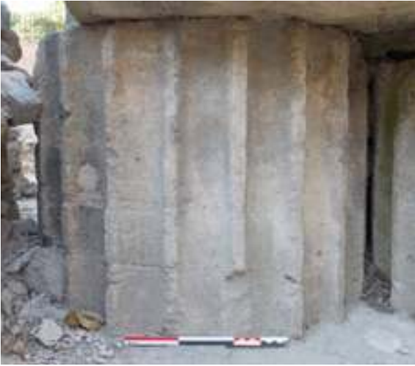
Fig. 16 - Tambour d'un fût cannelé de colonne orné de 20 cannelures et d'un diamètre de 70 cm, réemployé dans la fondation du chevet de la cathédrale Notre-Dame-de-Nazareth (n° inv. : VAI.CATH.19) (C. Lefebvre).