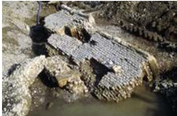
Fig. 4 - Vestiges du mur-digue de la rive gauche de l'Ouvèze dégagés durant les fouilles de 1996 (J.-M. Mignon, Service d'Archéologie du Département de Vaucluse).

Ce n'est que près d'une cinquantaine d'années plus tard qu'une nouvelle étude est entreprise par l'architecte et archéologue J.-M. Mignon 6 après la crue du 22 septembre 1992 qui fait réapparaître les vestiges signalés par J. Sautel ensevelis sous les berges 7 . L'année suivante, en septembre 1993, un sondage est réalisé afin d'identifier le dispositif antique et d'effectuer une série de prélèvements sur les pieux pour une analyse dendrochronologique. L'ensemble des observations permet de reconnaître la nature de la construction qui constitue un mur d'endiguement et de fixer une datation pour l'abattage des pieux en chêne à la fin du I er siècle de notre ère, et plus précisément en l'année 82. En 1996, une fouille de sauvetage est entreprise avant la destruction partielle des vestiges engendrée par le tracé d'une nouvelle digue. Le dégagement permet la mise au jour de ce mur-digue sur une longueur de près de 80 m et qui devait s'étendre à l'origine sur plusieurs centaines de mètres, probablement sur toute la portion urbaine de l'Ouvèze 8 . Seule une partie de la fondation du dispositif observée par J. Sautel a été retrouvée en place. L'élévation de l'extrémité occidentale de la section du mur-digue a été repérée dans le lit de la rivière, basculée dans ce dernier à la suite d'une crue plus ancienne (fig. 4). L'élévation a