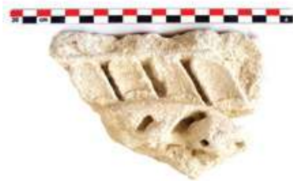
Fig. 13 - Fragment d'un chapiteau corinthien de modestes dimensions avec « Fiederblätter » (n° inv. : VAI.CATH.NORD 81.3) (C. Lefebvre).

qui était situé dans le voisinage » 28 . Dernièrement, une mission archéologique nommée « Vaison 3D » menée en mai et juin 2016 pour le relevé 3D de la cathédrale Notre-Dame-de-Nazareth sous la direction de C. Michel d'Annoville, a relancé l'étude du monument et celle des réemplois architecturaux observés par J. Sautel.