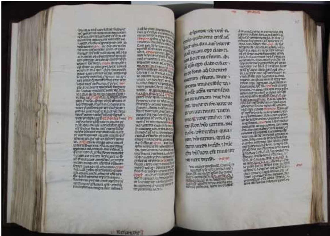
Page de la Catena aurea sur l'évangile de Jean, premier quart du XIV e s., appartenait au couvent des Augustins de Toulouse en 1789 (Toulouse, Bibl. mun. 46)

=edit-body-und-0-value&Toolbar=Wysiwyg - ftu2 . Il en prit occasion pour composer sa « Catena aurea » ( Chaîne d'or ), nom moderne donné à un commentaire continu des quatre évangiles composé comme une mosaïque de fragments découpés dans les commentaires patristiques des passages correspondants, et collés à la suite de chacun des passages des évangiles reproduits en gros caractères. La Catena a été rédigée en Italie, d'abord à Orvieto puis à Rome, entre 1263 et 1266 environ, et dédié d'abord au pape Urbain IV, puis à l'ancien élève et ami de Thomas d'Aquin, le désormais cardinal Annibald de Annibaldi.