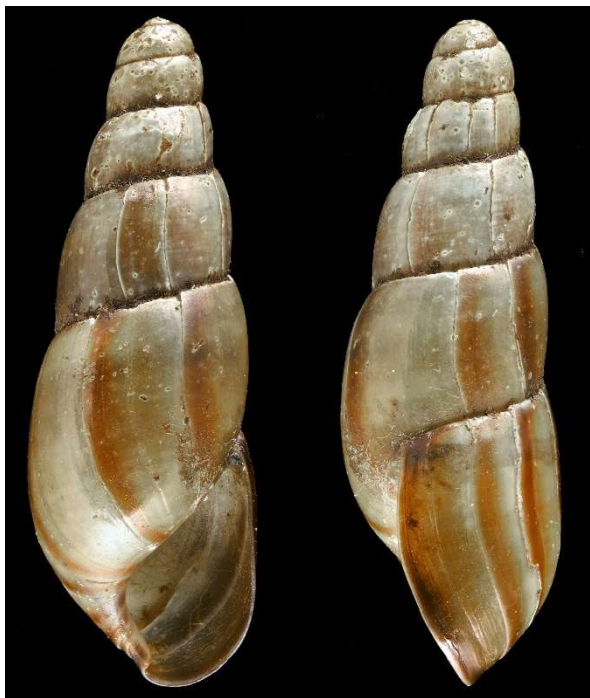
Figure 1 : Vue aperturale et vue latérale de la coquille de Laevaricella guadeloupensis collectée sur la crête Mahault. La coquille mesure 10 mm de haut. Collection Muséum de Bordeaux – sciences et nature, MHNbX 2019.16.1.