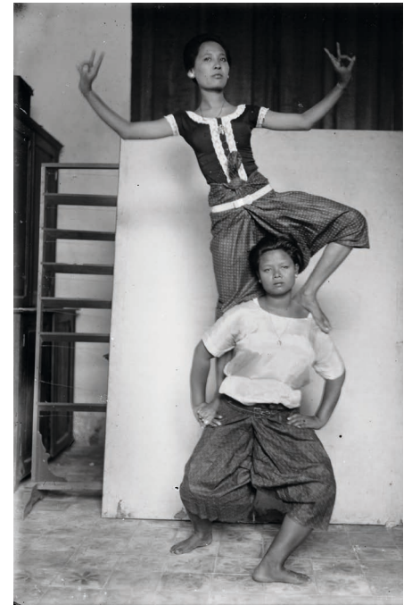
Figure 10. — Ith et une danseuse non identifiée représentant le dieu Viṣṇu et sa monture Garuḍa.