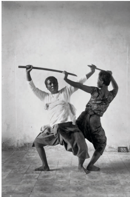
Figure 9. — Scène de combat avec la grū Lèk de face, probablement dans un rôle de démon opposé à un personnage simiesque joué par une danseuse non identifiée.

L'installation réalisée semble-t-il avec les moyens du bord est plutôt sommaire. Un fond constitué d'une toile tendue sur