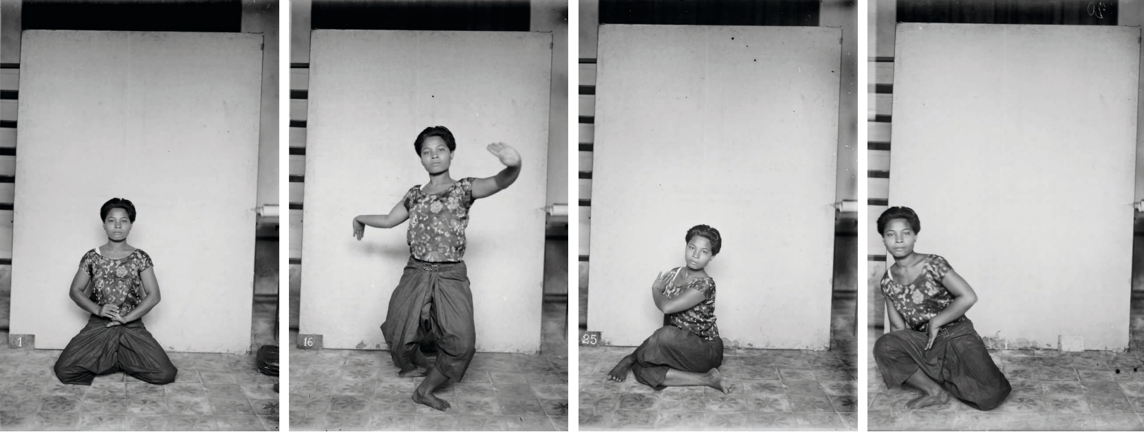
Figure 2. — Danseuse non identifiée jouant un rôle de singe (clichés MNC 070.01d / 22.15d / 222.05d / 127.02d).

Lorsqu'il débute son projet voué à la sauvegarde de la danse de cour du Cambodge, G. Groslier estime qu'il y a urgence. C'est pourquoi il choisit, dans un premier temps, d'en produire une trace matérielle qui puisse résister au temps avant de chercher à revivifier la pratique en elle-même. Dans le but de « constituer [...] un répertoire de toutes les poses traditionnelles », G. Groslier choisit de réaliser des images fixes plutôt que d'avoir recours à la cinématographie comme l'auraient imaginé certains de ses contemporains 10 . Il souhaite, en effet, prendre le temps de faire corriger chacune des postures par une professeure avant la prise de vue plutôt que de risquer de fixer quelque chose d'imparfait en filmant des séquences dansées dans leur intégralité 11 . Ce choix de la photographie pour rendre compte de la danse à une époque où le cinéma se développe n'est pas anodin mais peut aussi se comprendre au regard de certains principes fondamentaux de la danse de cour cambodgienne.