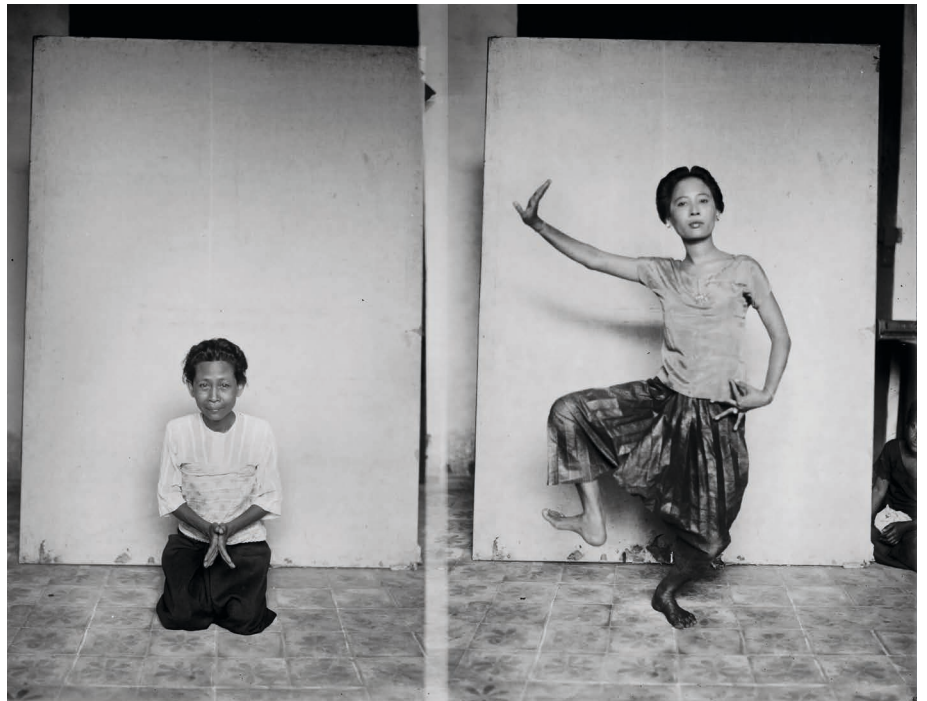
Figure 6. — Nou Nâm à gauche et Ith à droite sur une même plaque (clichés MNC 017.12g et 017.12d).

ne comptant que quelques rôles mineurs à vocation comique réservés à des interprètes masculins 22 . La gestuelle de ces personnages était plus mimée que dansée et c'est pour cette raison qu'ils ne sont pas représentés dans l'inventaire.