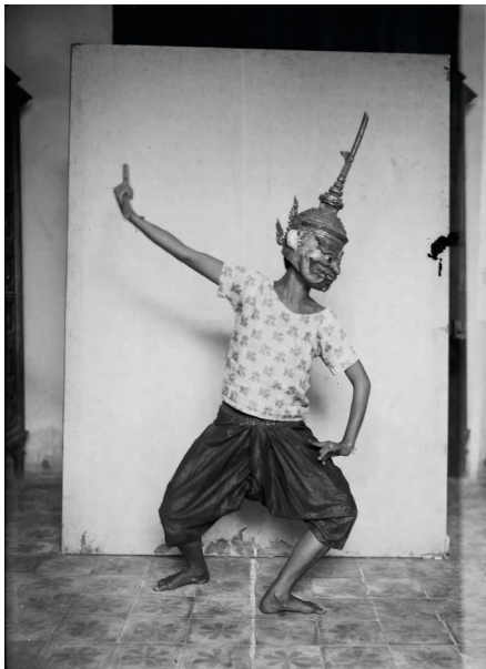
Figure 8. — Suon masquée, « Un corps charmant, élégant, mais une face ingrate avec un nez cassé, ce qui n'a pas d'importance, parce qu'elle assure les rôles de yaks, de géants, qui comportent un masque. » GROSLIER 1928, p. 540.