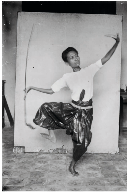
Figure 17. — Nou Nâm à l'arc (clichés MNC 092.15g / 092.01d).

Les remarques faites par les danseuses interrogées sur les séries de clichés concernaient le plus souvent les différences observables entre l'inclinaison du buste, la hauteur des bras et des mains ou encore l'amplitude des membres entre l'époque du roi Sisowath et aujourd'hui. Il est en effet notable que la différence entre les personnages féminins et masculins est plus nette aujourd'hui qu'elle ne semble l'avoir été à l'époque. Cette différence est due à l'intervention de la reine Kossamak qui fut en charge du ballet royal sous le règne de son fils, Norodom Sihanouk, à partir de 1941. Cherchant notamment à différencier la danse khmère de son homologue siamoise, elle entreprit une normalisation de la gestuelle en redéfinissant l'amplitude de mouvement différenciant chacun des grands types de personnages : gestuelle des bras et des jambes dite « fermée » pour les personnages féminins et proportionnellement plus « ouverte » pour chacun des autres personnages.