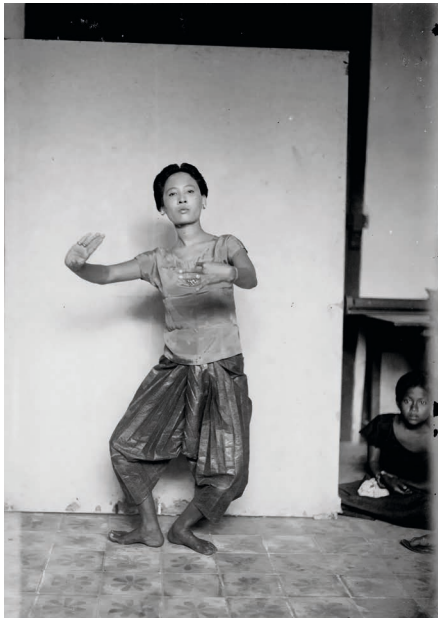
Figure 7. — Ith, « C'est une indépendante. Elle est déjà allée en France à l'exposition coloniale de 1922. Elle apparut avec un bon sourire, une fleur rouge sur l'oreille, son port de tête altier. Elle joue les rôles de princes, de héros. Je la soupçonnais indolente et m'aperçus bientôt que je me trompais. La vie cloîtrée du Palais lui pèse et elle s'ennuie. » GROSLIER 1928, p. 539.