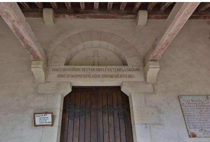
Fig. 6 : inscription (moderne) sur le linteau de la porte latérale sud.

Bien qu'inscrit tardivement, selon une technique différente et sur un support éloigné de son emplacement d'origine, ce texte continue de témoigner de la volonté du commanditaire d'associer son nom à son œuvre et de bénéficier de l'intercession des fidèles entrant dans l'édifice pour obtenir le salut éternel.