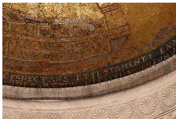
Fig. 8 : Inscription (restaurée) à la base de la mosaïque orientale, détail.

Peu nombreuses, certaines à l'authenticité douteuses, ces inscriptions de Germigny restent donc finalement fondamentales pour comprendre l'édifice et, en confirmant son attribution à la volonté de Théodulf d'en faire à la fois un oratoire à sa mémoire et un lieu de culte digne des plus grandes églises, lui donnent une place singulière dans l'histoire et l'art du monde carolingien.