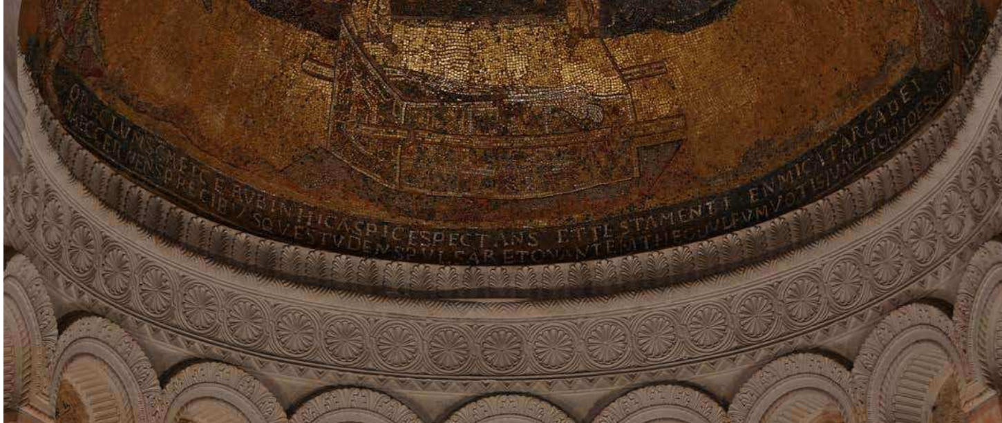
Fig. 7 : Inscription (restaurée) à la base de la mosaïque orientale.