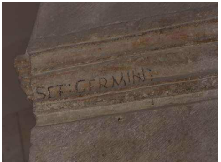
Fig. 4 et 5 : Inscriptions (fausses) sur les talloirs nord et ouest du chapiteau nord à l'entrée du chœur.

An(no). incar(natio)nis. do(mi)ni. DCCC. et. VI. / sub invocatione. S(an)tce. Ginevrae. et // s(an)ct(i). Germini