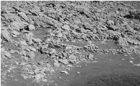
Figure 3 : une cabane entourée de trois enclos (Caillaoulat, Estive d'Anéou)