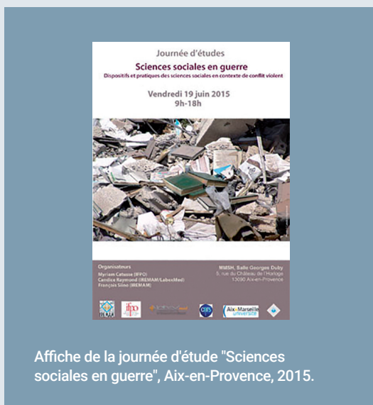
Affiche de la journée d'étude "Sciences sociales en guerre", Aix-en-Provence, 2015.

peu interrogés par la littérature consacrée à l'histoire et la sociologie des SHS au Proche-Orient. Ce champ de recherches, en constant développement depuis deux décennies, a pourtant largement contribué à une meilleure connaissance de la genèse des institutions de savoir et de la fabrique des acteurs scientifiques, en privilégiant surtout deux problématiques : les rapports des sciences sociales autochtones avec l'héritage des sciences coloniales et/ou la recherche menée au Nord ; la construction des systèmes scientifiques nationaux concomitamment à celle de l'État. En revanche, ces travaux se sont peu intéressés aux effets structurants des conflits violents ayant fait suite aux processus de décolonisation et de consolidation des États indépendants, conflits qui représentent pourtant bien souvent une expérience commune à des sociétés engagées dans des dynamiques de redéfinition des modes de partage du pouvoir et des identités politiques et culturelles. C'est précisément autour de ces questions que se dessine un axe de travail au DEC. La réflexion sur les effets des Printemps arabes sur les sciences sociales, amorcée lors de la préparation d'un dossier thématique pour la Revue des Mondes Musulmans et de la Méditerranée (REMMM) paru en 2015, montrait en premier lieu tout l'intérêt à se saisir de ces