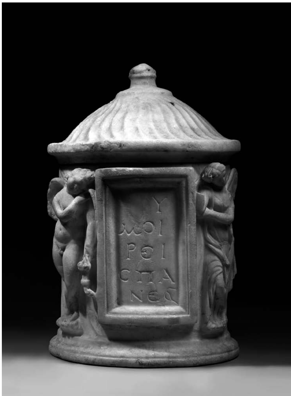
Fig. 2. Epígrafe en detalle