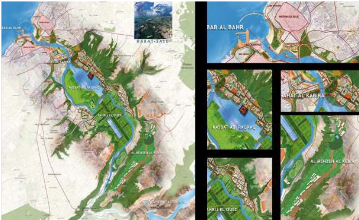
3. Parti d'Aménagement Global (PAG) de la vallée Bouregreg

Le périmètre d'aménagement du projet est subdivisé en six séquences consécutives. La séquence Bab Al-Bahr [Porte de la Mer], qui nous intéresse ici, est le premier jalon du projet censé créer une nouvelle centralité. Les premiers espaces publics relevant de cette séquence ont été livrés en 2007, dont le quai de Rabat, qui en constitue un des principaux éléments. Le quai est constitué d'une promenade, en partie accostable, le long de l'oued Bouregreg. C'est désormais une voie piétonne sur berge, longue de 1,5 km, dotée de restaurants-cafés sur terre et sur pilotis. Un débarcadère est réservé aux barcassiers [ flaikiias ] qui, depuis toujours et pour quelques dirhams, assurent la traversée entre Rabat et Salé à partir de plusieurs points d'amarrage. Le quai a été aménagé selon des standards internationaux classiques, c'est-à-dire avec un mobilier urbain, des matériaux et des éclairages que l'on peut retrouver sur tous les waterfront de la planète (Chaline, 1994, 1998) : pavés, rambardes de protection en style passerelle de paquebot, luminaires design, etc.