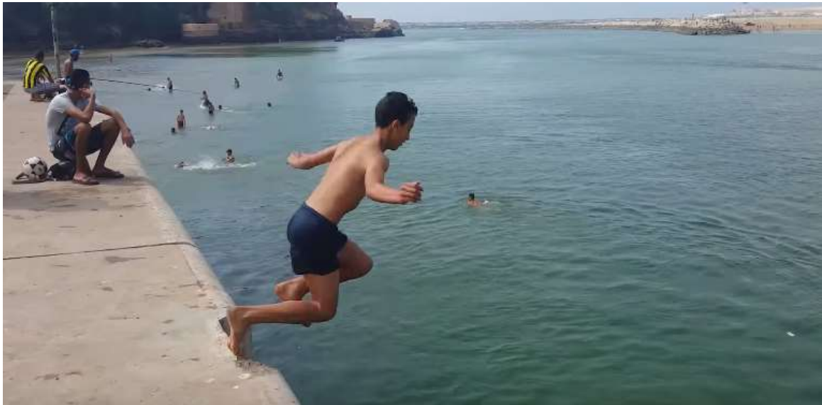
4. La baignade dans le Bouregreg, une scène immanquable sur le quai de Rabat pendant l'été. (Moussalih, 2014)

En se donnant en spectacle, ces adolescents, sans toujours le savoir, perpétuent ainsi l'ancienne pratique de la traversée du Bouregreg à la nage, même s'ils se limitent au plongeon sous les applaudissements et les encouragements des spectateurs et de leurs ami(e)s.