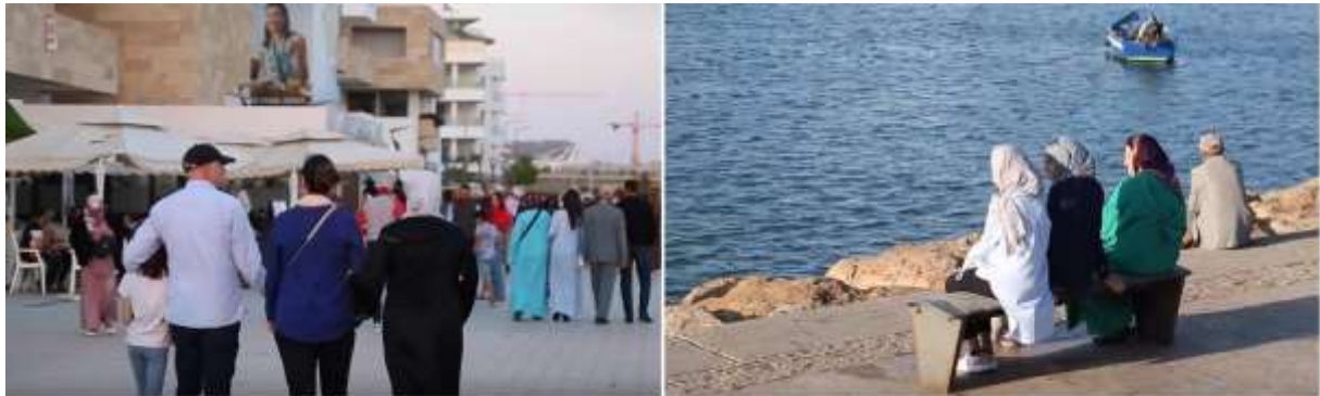
6. La promenade et le code vestimentaire comme formes d'urbanité et de liberté (Moussalih, 2014)

Dans une tenue qui révèle une recherche d'élégance, les usagers investissent largement ces espaces. Le code vestimentaire, à travers son usage classique et traditionnel, avec ajustement (maquillage, foulard, djellaba, longueur des jupes) ou hybridations (hijab, maquillage et vêtement près du corps), constitue une façon de s'exprimer, un langage. Il fournit une multitude d'indices sur le sens du lieu chez ses usagers. Car pour eux, se rendre sur le quai de Rabat, c'est participer à un lieu de valeur dans la ville (figure 6).