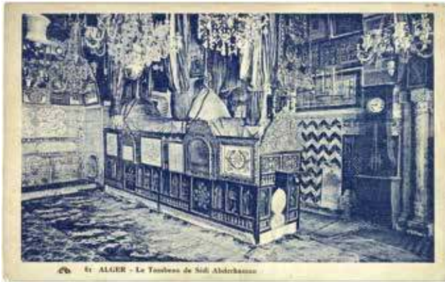
1. La tradition veut que les lustres du Mausolée de Sidi Abderhaman dans la casbah d'Alger, aient été offert par la reine Victoria, en remerciement de son souhait d'avoir un enfant. Carte postale, vers 1910.

lait sans raison, restituer un héritage spolié, se débarrasser d'un voisin trop encombrant, ramener l'amant volage auprès d'une délaissée, etc. » (Adly 2007.)