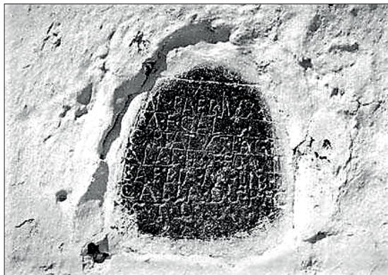
FIGURA. 8. IMAGEN DE LA INSCRIPCIÓN EE IX, 140. (Archivo digital de Hispania Epigráfica Online).

siquiera es segura. A. Canto, la única que da la lectura correcta como lag- , y no lac- , antes de ERBC había propuesto en HEp la posibilidad de Lag(obrigensis) , que tampoco parece que sea factible 80 . Posible es considerar un cambio de sorda / sonora (k/g), aunque parece difícil, ya que es curioso que, a pesar de la variabilidad del topónimo, todos los manuscritos, inscripciones y formas posibles conserven la raíz Lac- y no Lag- . Es difícil asumir como cierta la idea que se recoge de aquellos que asumen que hubo dos ciudades si miramos la epigrafía, porque la hipotética Laci(ni)murga de promoción cesariana no habría dejado registro epigráfico alguno más que una dudosa mención de origen, mientras que la Laci(ni)murga sin estatuto privilegiado hasta época flavia, expresa epigrafía geográfica desde principios del siglo I y se cita su topónimo, no en una sino en cuatro ocasiones.