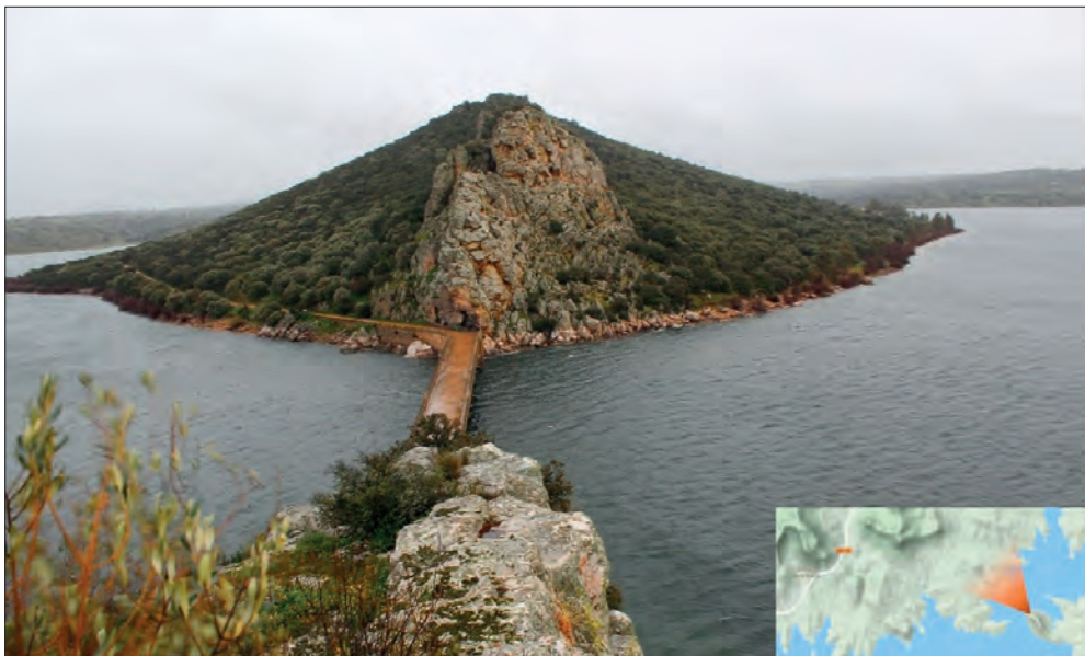
FIGURA 4. VISTA EN DIRECCIÓN SUR DESDE LO ALTO DE CERRO DE COGOLLUDO. AUNQUE DEBIÓ DE SER, IGUALMENTE EN LA ANTIGÜEDAD, ZONA DE HUMEDALES, ESTA VISIÓN SE DA POR EL EMBALSE DE ORELLANA Y SIERRA DE PELA. (Foto del autor).

Estos datos filológicos hay que ponerlos en contexto. Este topónimo apunta directamente a un origen turdetano. Si tenemos en cuenta la probada colonización tartésico-turdetana que se dio en el valle del Ana en torno al siglo VI a.C. y que, producto de ello, les llevó a fundar ciudades desde la desembocadura ( Baesuris ,