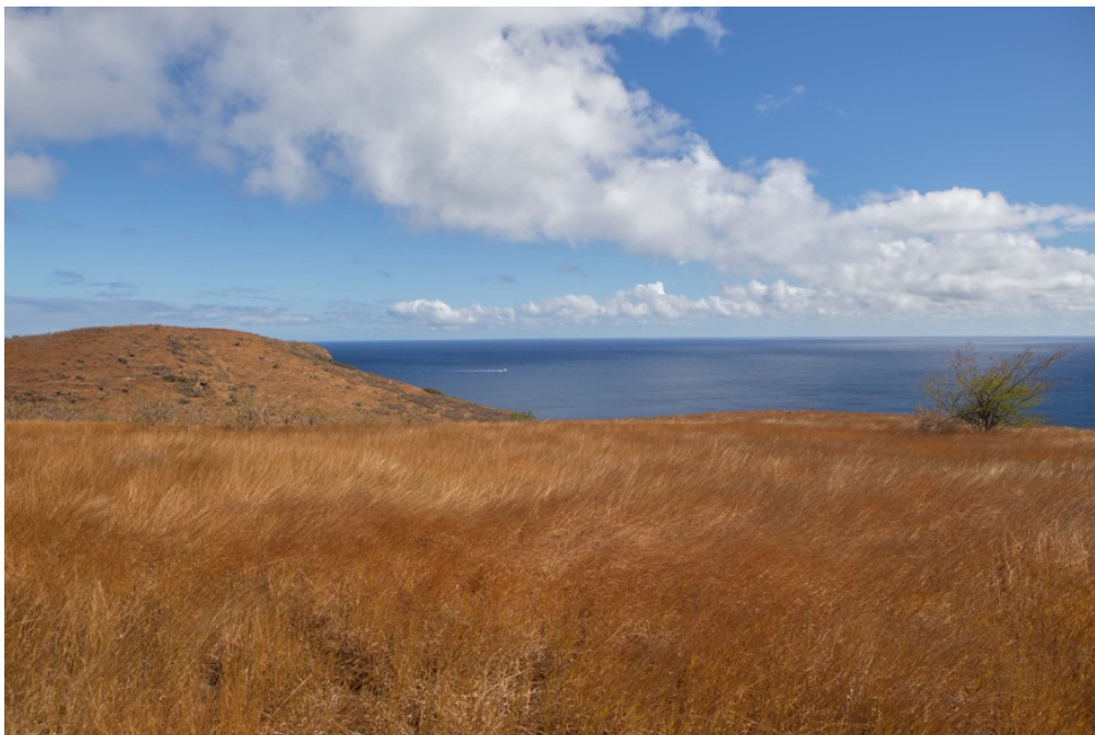
Ill. 1 : Savane côtière du Cap La Houssaye et du Cap Champagne.

En l'occurrence, nous pouvons également parler d'une recherche-projet « paysagère », dans la mesure où le paysage perceptible est ici mobilisé comme une entrée privilégiée dans la recherche et un objet médiateur (que nous nous efforçons de construire comme tel), à la fois support d'échange entre les chercheurs et entre eux et les habitants/acteurs concernés par leurs travaux. Le paysage est considéré ici comme la partie émergée du complexe socio-écologique que constitue l'« environnement », sa face perceptible et son image, qui ne livrent pas de lui un reflet parfaitement fidèle, mais se présente, en tant que donné sensible, comme la surface de contact poreuse par laquelle la culture (et avec elle le pouvoir de réflexivité des hommes) pénètre au cœur des processus naturels. Le paysage, jamais réductible à un donné objectif, réalité sensible de toute part pénétrée par les représentations sociales, est ainsi à la fois l'effet et l'un des déterminants des processus environnementaux, un produit et une matrice (Berque, 1984), un point d'aboutissement et un point de départ, une fin et un moyen.