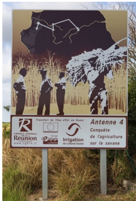
Ill. 3 : Panneau célébrant la « Conquête de l'agriculture sur la savane », à l'Ermitage.

l'attractivité du littoral sous le vent (Germanaz et Sicre, 2012) ; mal, aussi, avec les images de référence mobilisées par les promoteurs et les architectes, qui ordonnent la représentation et la production de l'urbanité insulaire. La politique visant à étendre les terres agricoles sur la zone littorale est elle-même volontiers présentée par ses promoteurs sous l'angle d'une salutaire « reconquête » des espaces « abandonnés » à la savane, comme le proclament aujourd'hui encore quelques panneaux placés en bord de route au niveau de l'antenne d'irrigation n°4.