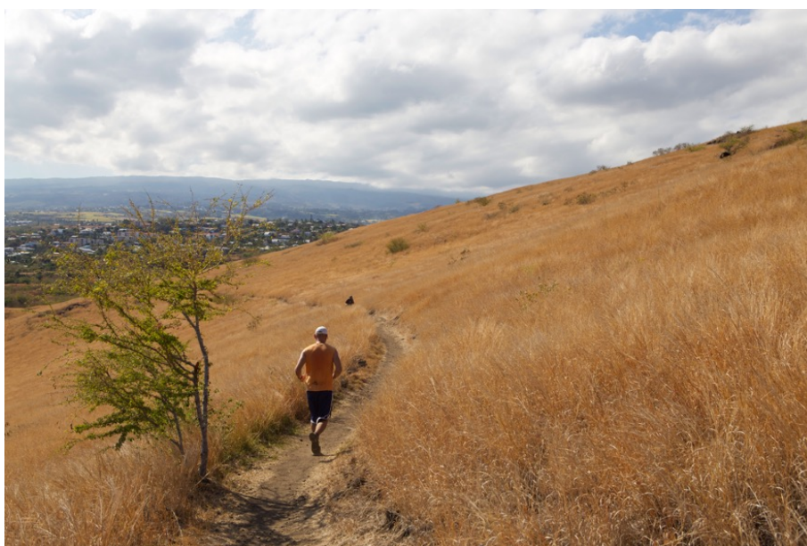
Ill. 5 - Jogger au Cap La Houssaye