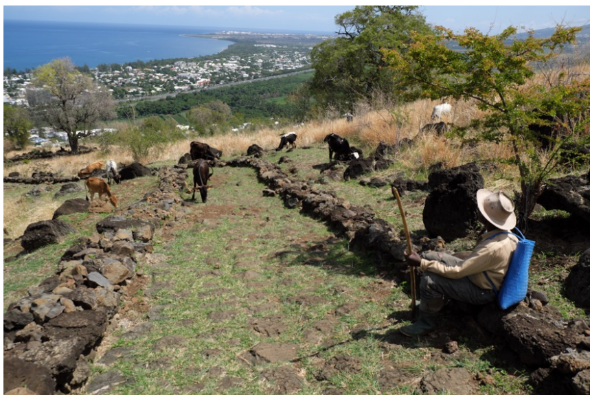
Ill. 2 : Bœufs mokas sur la savane de Crève-Cœur (Saint-Paul) et son chemin pavé