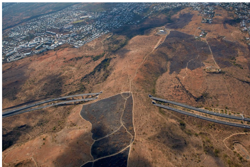
III. 4 - Traversée des savanes du Cap La Houssaye par la Route des Tamarins.