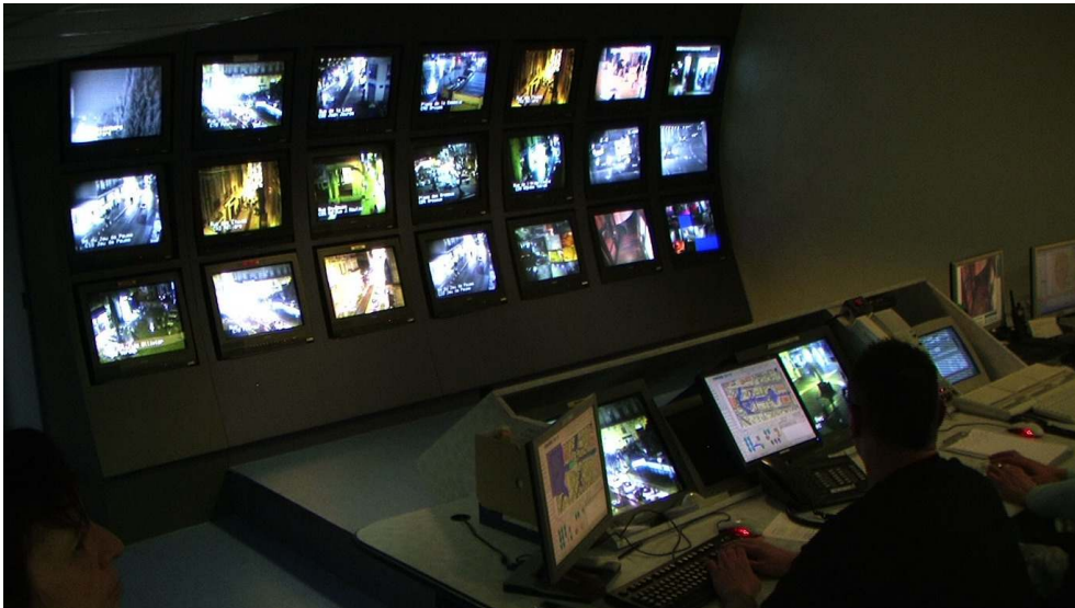
Figure n° 4 : Vue d'ensemble du mur d'écran des opérateurs du CSU