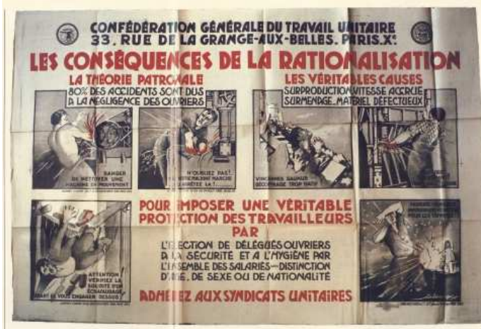
Affiche de la CGTU, 1928.