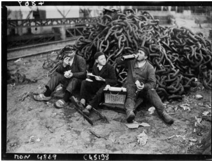
Illustration 1 : « Après le lancement, trois ouvriers des chantiers navals cassent la croûte », 1932.