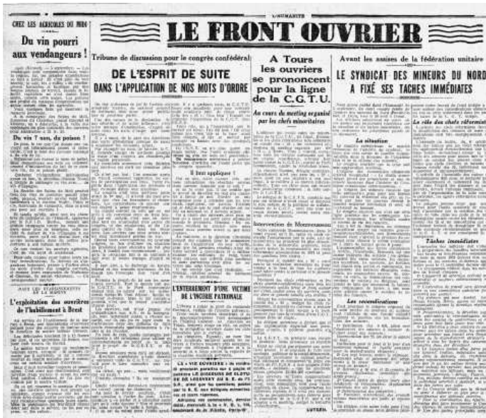
« Du vin pourri aux vendangeurs ! », L'Humanité , 7 septembre 1931.