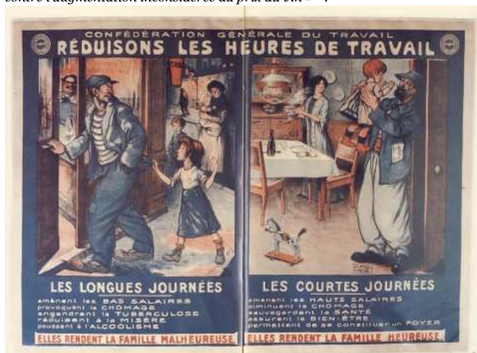
Affiche de la CGT, 1912.