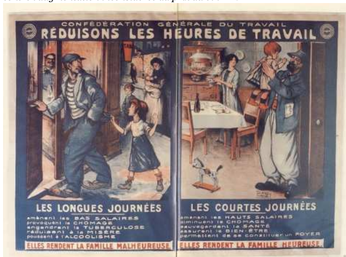
Affiche de la CGT, 1912.