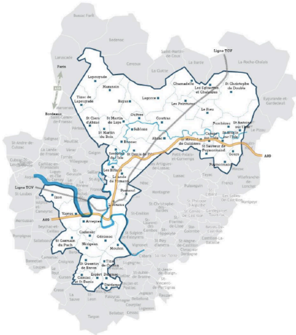
Carte 1 : La CALI en 2017 (CALI, 2018)

La partie sud bénéficie de l'influence dynamique de la métropole bordelaise 4 . Cela lui confère