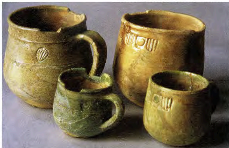
Fig. 1 : Mesures revêtues d'un émail monochrome. Montpellier, puits de la rue de la Barralerie. Fin XIII e -début du XIV e s. Coll. de la Société archéologique de Montpellier.

le commerce international, qui appartient à la couronne d'Aragon puis à celle de Majorque entre 1204 et 1349. Il s'agit pour l'essentiel de vaisselle de table, pichets et coupes, de vases à pharmacie, ornés de motifs géométriques peints en vert de cuivre et brun de manganèse ou recouverts d'un émail monochrome. Les plus anciens exemplaires concernent des objets peu courants, des mesures marquées aux armes de la ville et de ses souverains majorquins, donc datables de la fin du XIII e ou de la première moitié du XIV e s. (figure 1).