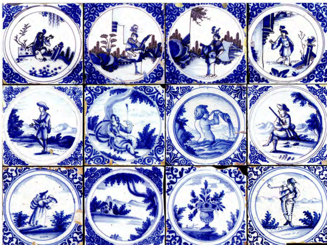
Fig. 14 : Ensemble de carreaux provenant d'une cheminée languedocienne. Coll. particulière. Cl. J.-L. Vayssettes, LA3M.

Dès les premières décennies du XVIII e s., la manufacture eut aussi une production dans le goût de Berain, attestée par les fragments découverts à son emplacement. Grâce à ceux-ci, il est possible d'attribuer à la manufacture des plats de grandes dimensions ornés de tableaux représentant des scènes bibliques, mythologiques, théâtrales ou burlesques. Un dessin préparatoire d'un des décorateurs de cette époque nous est même parvenu, il est l'œuvre du peintre en faïence Laurent-Charles Hubert, actif à Montpellier de 1712 à 1724. A un autre décorateur de la manufacture, nous devons une série très caractéristique de motifs de tapis ou de tentures, se retrouvant sur des carreaux de revêtement et sur plusieurs plats.