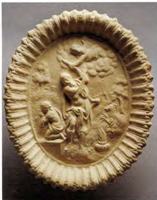
Fig. 11 : Fontaine en camaïeu de bleu attribuée à l'atelier de Jacques et Etienne Boissier. Montpellier Métropole, Musée Fabre.