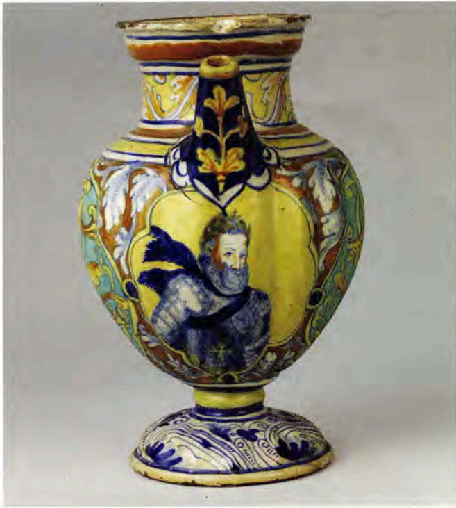
Fig. 4 : Chevrette, « S. d. Papa » au portrait de Henri IV portant l'ordre du Saint-Esprit. Course d'acanthé sur le col. Première moitié du XVII e s.. Ancienne collection Sagnier. Sèvres, Cité de la Céramique.

aussi ceux de Frontignan, Aix-en-Provence, Marseille et même Genève, en pots canons, chevrettes, pots à conserve et piluliers, parfois godronnés comme l'indiquent certaines commandes et quittances qui s'égrènent tout au long de sa longue existence. Il meurt en 1682 dans sa 90 e année.