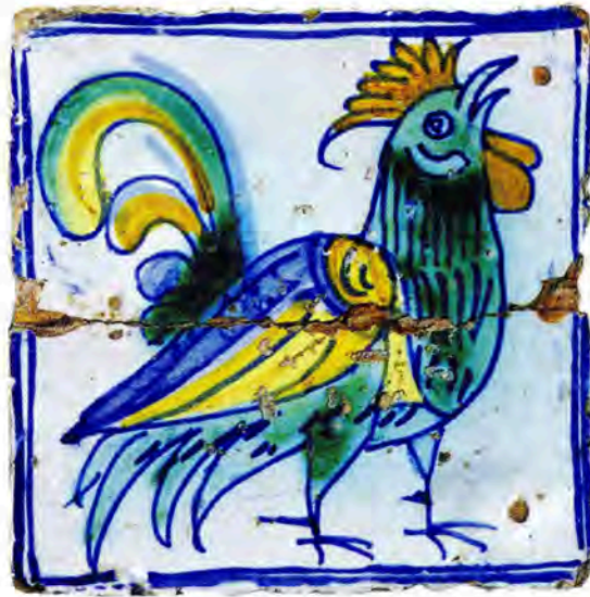
Fig. 3 : Carreaux découverts à Pézenas, attribuables à l'atelier de Pierre Estève provenant du château de Pézenas. Milieu du XVI e s.

douzaines de cabretes et pots grands et petits, pints », c'est-à-dire des majoliques. Malgré son déménagement, Estève ne rompt pas toutes ses relations avec la société piscénoise. A la fin de sa vie, il travaille encore pour le compte d'Henri Ier de Montmorency, en ses domaines de la Grange des Prés et d'Alès. Enfin, un autre texte renforce l'attribution de ces carreaux émaillés à Pierre Estève car ce dernier fournit en 1573, à un autre apothicaire montpelliérain, plus de 1300 carreaux dont « quatre cens maons peincts de belles et haultes colleurs, à rozes [auxquels...] Estève sera tenu aussusdits maons faire une douzaine d'armoiries dudit sieur Montchal et aultre douzaine d'armoiries de la femme d'icellui ». Malheureusement nous ne savons rien sur l'origine des connaissances de Pierre Estève. Seuls ses liens avec les Montmorency constituent un indice sur l'acquisition d'un tel savoir-faire par un potier méridional car dans l'entourage du Connétable gravitent plusieurs Italiens.