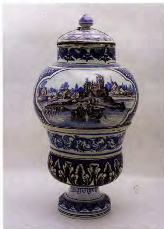
Fig. 12 : Vase de montre en camaïeu bleu et de manganèse, avec un paysage pastoral, d'un côté, et une marine de l'autre, « Sal. Vini ».

Du XVII e au XVIII e s., Ollivier perpétue la production de vases pharmaceutiques. Certains sont de remarquables compositions décoratives comme le pot de montre du musée de Pézenas (figure 12). Les récipients de la Manufacture royale envahissent les rayonnages des apothicaireries de Montpellier, celles de l'hôtel-Dieu Saint-Éloi et de la Miséricorde ainsi que de tout le Midi de la France, à Pont-Saint-Esprit, Carpentras, Avignon, Perpignan, Pézenas, Narbonne etc. Les pièces de Pont-Saint-Esprit viennent de Montpellier comme l'attestent les analyses d'argile réalisées par Maurice Picon ; de même que celles de Tarascon livrées par Ollivier depuis Beaucaire à la fin de la foire de la Magdeleine. Parfois, les peintres recherchent le