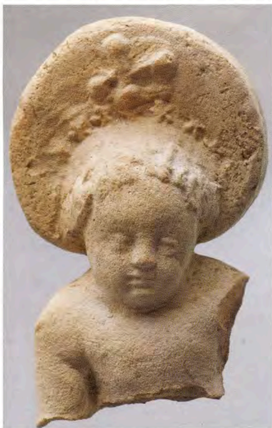
Fig. 2. Statuette d'Enfant Jésus, dépotoir de l'atelier de la porte de la Blanquerie à Montpellier. XV e s.

Les analyses d'argile effectuées sur l'ensemble du matériel, en pâte calcaire, émaillé ou sans revêtement et cuit selon le mode oxydant ou réducteur, confirment une origine commune et