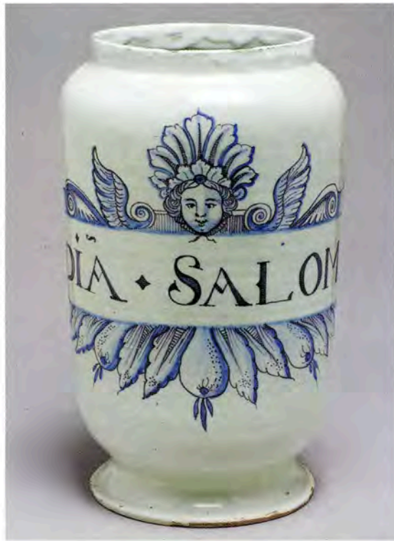
Fig. 13 : Pot pharmaceutique « OpĪa.SalomĪ ». L'encadrement du cartouche constitue à lui seul le décor. Pharmacie de Tarascon. Château.

raffinement dans la finesse du dessin et l'extrême simplicité du décor (figure 13).