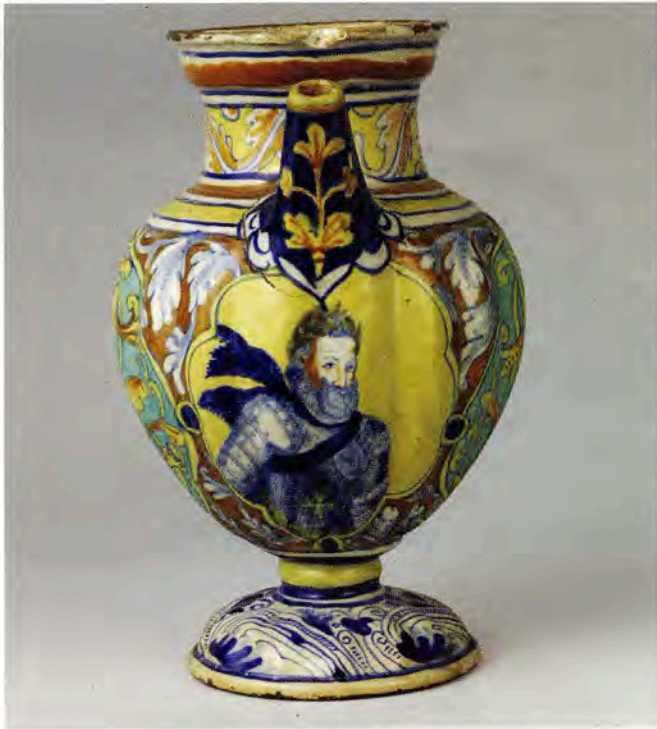
Fig. 4 : Chevrette, « S. d. Papa » au portrait de Henri IV portant l'ordre du Saint-Esprit. Course d'acanthé sur le col. Première moitié du XVII e s.. Ancienne collection Sagnier. Sèvres, Cité de la Céramique.

aussi ceux de Frontignan, Aix-en-Provence, Marseille et même Genève, en pots canons, chevrettes, pots à conserve et piluliers, parfois godronnés comme l'indiquent certaines commandes et quittances qui s'égrènent tout au long de sa longue existence. Il meurt en 1682 dans sa 90 e année.