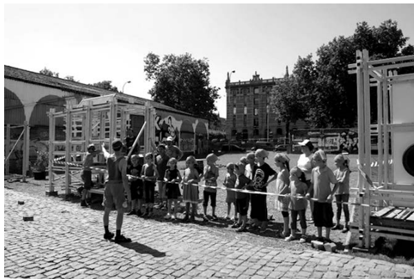
Figure 2 : Workshop de construction de jeux temporaires avec des enfants du quartier sur le quai des Matériaux, futur parc Beco, au bord du canal à Bruxelles ; en arrière-plan l'avenue du Port et les entrepôts royaux de Tour et Taxis.

événements donnés (réseaux militants, concerts, événements artistiques, etc). En parallèle de cette activation, le marché de maîtrise d'œuvre du futur parc a été attribué et le projet suit son cours, comportant également en interne la mise en œuvre d'une « trajectoire participative ». Piloté par Technum , des ingénieurs, il s'agit d'un groupement de nombreux mandataires, missionnés pour gérer un projet complexe et lourd, le marché incluant l'aménagement du parc, d'aires de jeux, de skate et de sport, mais aussi la destruction des bâtiments, la dépollution, etc.