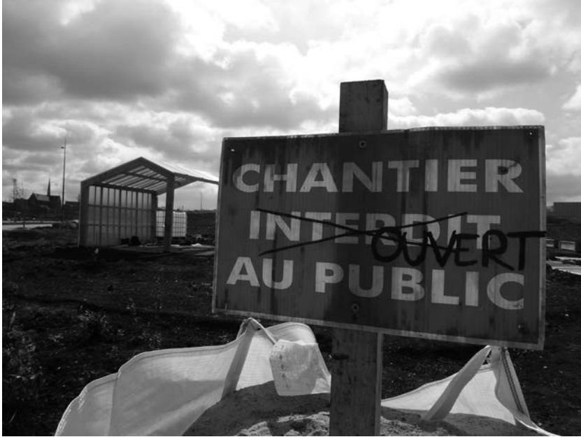
Figure 4 : Un des chantiers de la Fête des Jardins Rêvés 2013, zone de l'Union, Roubaix.

L'édition de la Fête des Jardins Rêvés de 2013 a lieu avec succès. Onze jardins sont réalisés sur 11 sites par des équipes constituées d'habitants, de structures locales, et d'étudiants ou de jeunes concepteurs, et font l'objet de conventions d'occupation temporaire. Deux ans après, environ la moitié des jardins sont encore actifs. Si certains sont menacés ou « posent problème » sur des sites où sont prévues des constructions, d'autres vont sûrement être pérennisés, soit qu'ils soient installés sur des lieux encore longtemps vacants (dont les projets sont à si long terme qu'ils en deviennent incertains) sur lesquels la SEMvr développe une stratégie de « gestion transitoire », soit qu'ils aient trouvé leur place dans un contexte en développement, comme le jardin associé aux bureaux d'une entreprise nouvellement implantée.