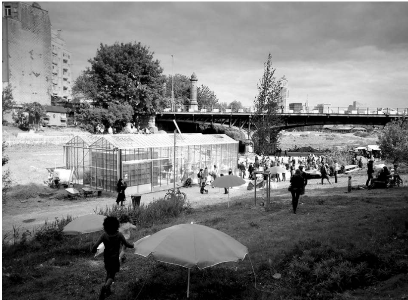
Figure 5 : Parkdesign, coulée verte, Tour et Taxis, Bruxelles.

aménagés, moins dessinés, moins définis, mais gérés de manière plus souple, capables d'accueillir une plus grande diversité de pratiques, d'équipements, d'usages, tout en laissant aux habitants une marge d'appropriation, de gestion, de transformation, qui leur permet d'être acteurs et actifs sur les lieux. Les concepts de jardin et de jardinage sont intéressants en ce qu'ils sous-entendent un espace où on est forcément actif. Ce qui est érigé en nouvelle utopie à travers ces projets c'est de construire de nouveaux liens à l'espace public et à la nature en même temps que de nouvelles formes d'action collective.