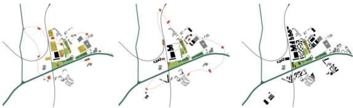
Illustration 2 : Schéma de l'évolution prévue à l'origine pour le projet du parc au fil des aménagements temporaires

Dans le cas du premier projet, la phase à laquelle on s'intéresse est terminée, le parc est en chantier et il est possible d'amorcer un bilan de l'expérience. Le constat est, de manière a priori assez unanime parmi les différents acteurs, que le processus de préfiguration temporaire et d'implication des habitants et le processus de conception du futur parc se sont progressivement détachés l'un de l'autre, aboutissant à une situation où l'on ne retrouve quasiment aucun élément de l'expérimentation dans le projet final ( Illustration 2 ). Pourtant, il existait au démarrage une solidarité très forte entre ces deux dimensions, pensées pour évoluer ensemble sur plusieurs années, portées conjointement par un unique maître d'œuvre et une maîtrise d'ouvrage enthousiaste ( Illustration 3 ).