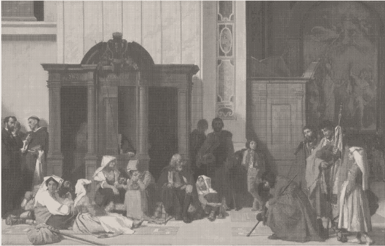
EUGÈNE ERNEST HILLEMACHERN, UN CONFESSIONNAL DE SAINT-PIERRE DE ROME LE DIMANCHE DE PÂQUES (1847) (MUSÉE D'ORSAY).