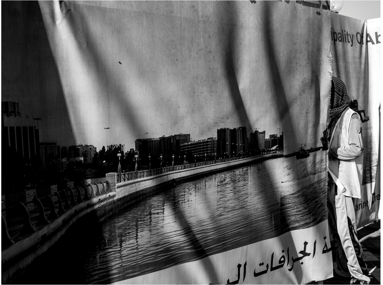
2 Abu Dhabi (EAU), crédit Manuel Benchetrit, 2012