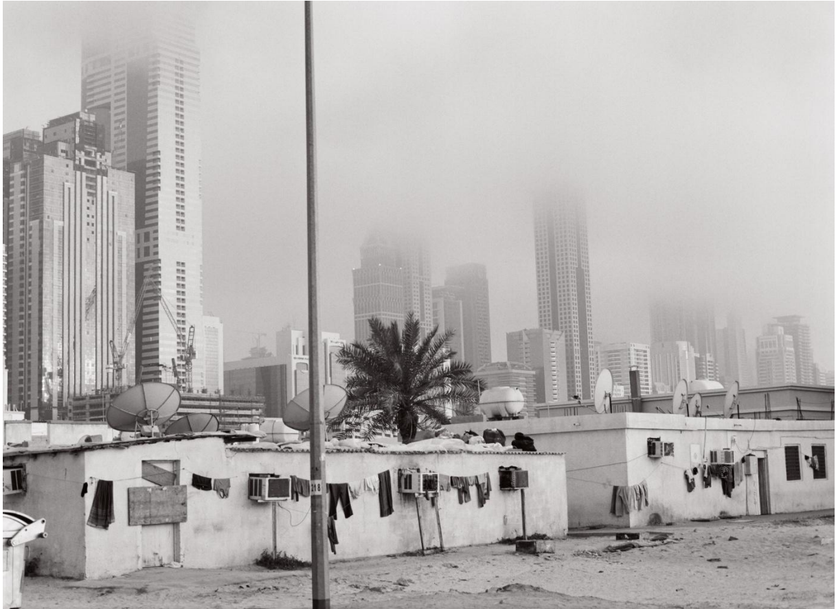
1 Dubaï (EAU), crédit Manuel Benchetrit, 2011