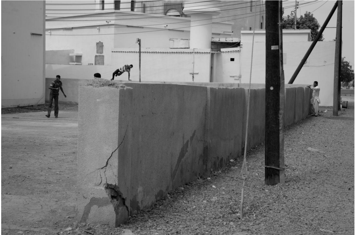
3 Mascate (Oman), 2011