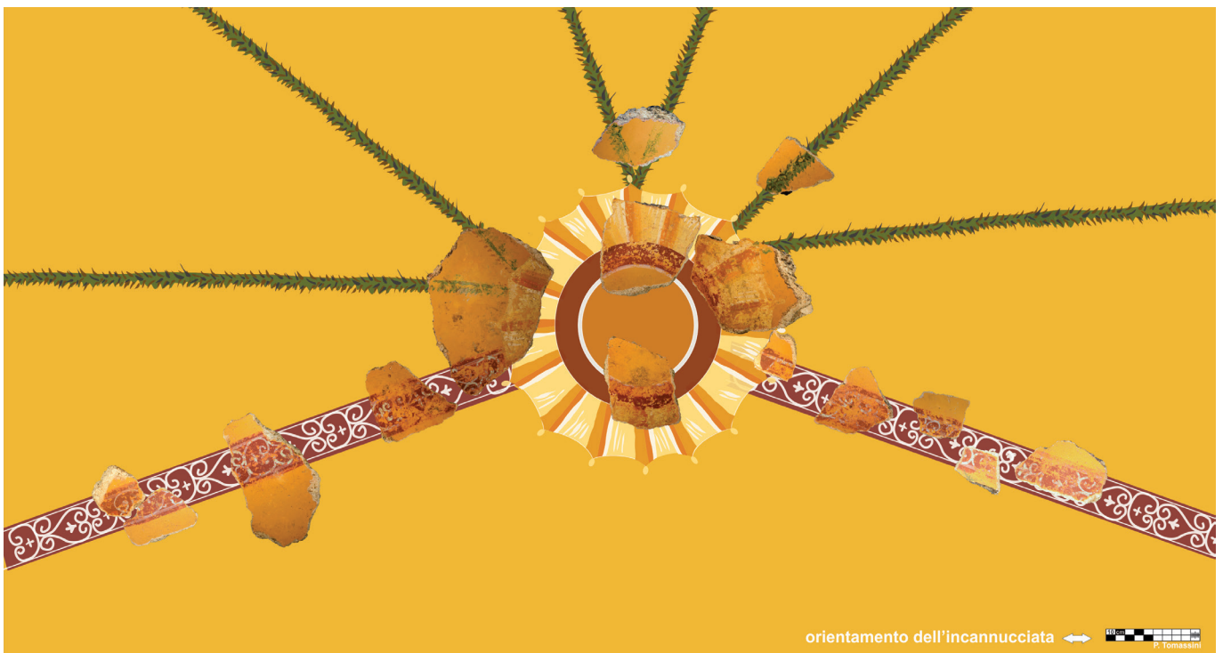
3. Gruppo di frammenti di soffitto dal Caseggiato delle Taberne Finestrate.