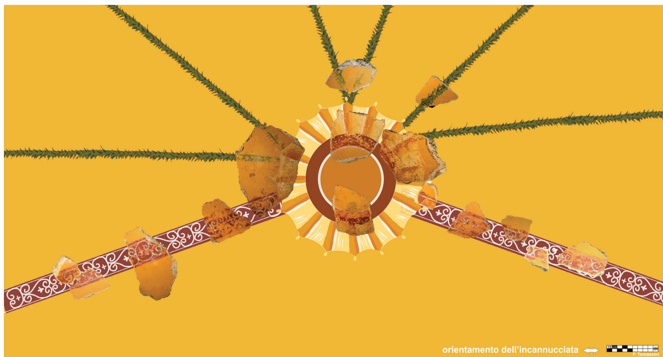
3. Gruppo di frammenti di soffitto dal Caseggiato delle Taberne Finestrate.