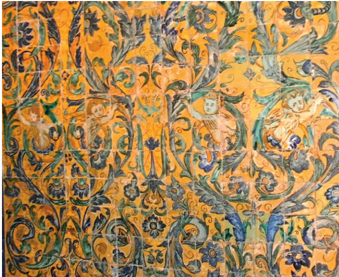
Fig. 2. Hernando de Valladares, ca. 1609. Azulejos policromos. Capilla de Rocamador, iglesia de San Lorenzo, Sevilla (España).

a una concepción de la ornamentación, de la perspectiva, de la substancia y de la forma.