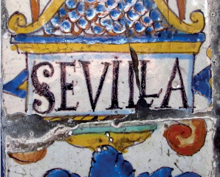
Fig. 4. Taller sevillano, ca. 1604-1606. Azulejos policromos, zócalos del convento. Santo Domingo, Lima (Perú).