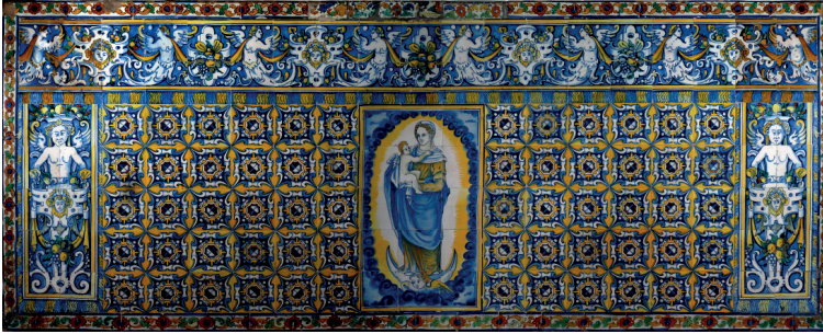
Fig. 3. Taller sevillano, Virgen con el niño Jesús , primer tercio del s. XVII. Azulejos policromos, 98 x 276 cm (aprox.). Convento de Madre de Dios de la Piedad, Sevilla (España).

adaptación de dicho modelo ornamental se vislumbra también a través de su evolución. De hecho, el acanto pertenece a un abanico de formas combinatorias como demuestran los grabados de Agostino Veneziano escenificando a una especie de genio híbrido, cuyas piernas se acaban en hojas de acanto. Este modelo inspiró de manera obvia las realizaciones de Valladares tanto en Sevilla como en las encomiendas destinadas al convento limeño de Santo Domingo. La perennidad de este modelo empleado por los artistas subraya su fuerza de adaptación a lo largo de los siglos, en diferentes edificios sagrados y sobre diferentes superficies.